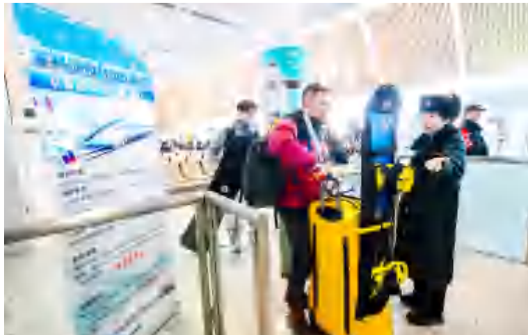
京张高铁,游客带雪具验票进站。

在体育赛事宣传方面,创新构建“周周有赛事、周周有直播”的新格局,实现赛事直播常态化。运营好“通通来运动”体育平台,提升品牌影响力,扩大体育影响力。