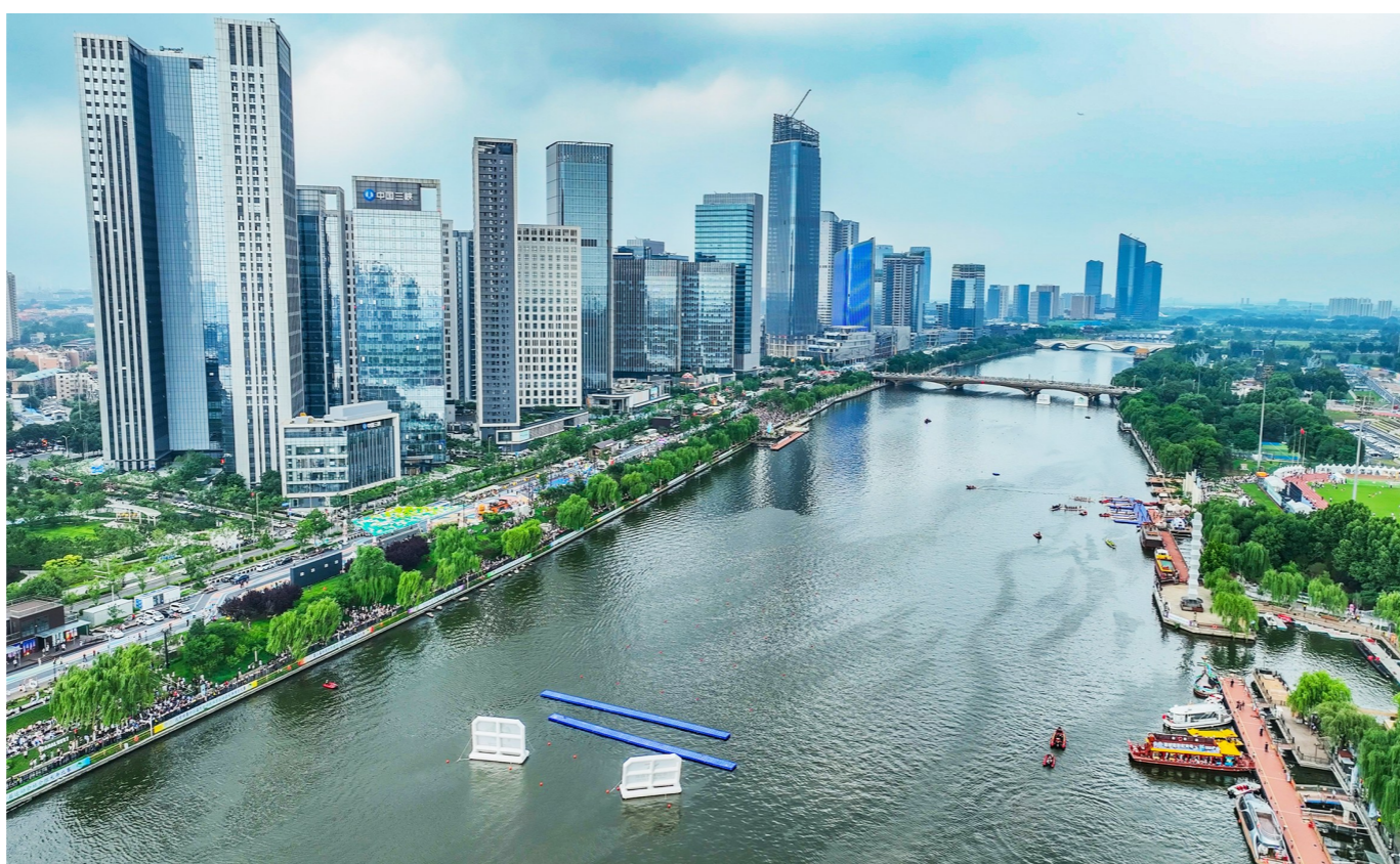
碧波绕城、楼宇依河，通州黄金水道尽显文旅新风貌。