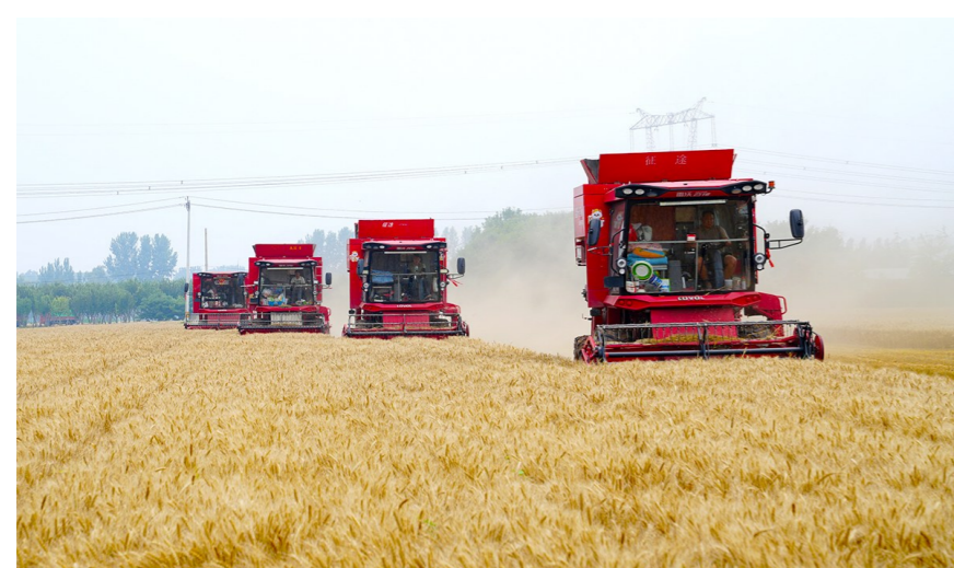
通州12.8万亩小麦丰收,麦收工作圆满收官。

本报讯(记者 田兆玉)夏至时节,麦浪翻滚,金穗飘香。随着一块块麦田收割完毕,通州区2026年“三夏”麦收工作基本结束。全区12.8万亩夏粮陆续颗粒归仓,在晴雨交替的复杂天气形势下,通过科学调度、抢抓抢种、安全护航,实现夏粮丰产丰收,牢牢守住区域粮食安全底线。