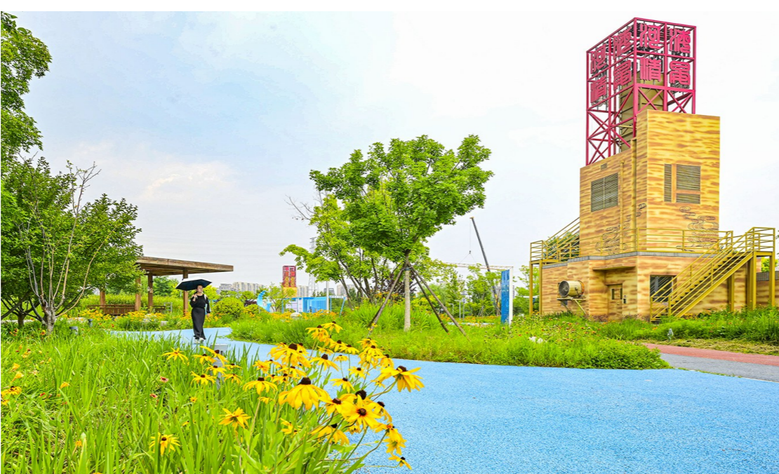
污水厂蝶变花海,市民游园赏花感悟绿色低碳。

不同于普通城市公园,碧水澜园暗藏城市绿色低碳发展的生态密码。园区依托再生水厂建设,将污水处理、水资源循环利用的市政民生工程,与城市公共休闲景观相结合,实现了污水再生利用、生态环境修复、市民休闲服务多重价值合一,是北京城市副中心海绵城市建设、