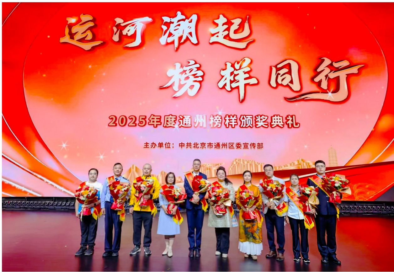
榜样们一个个鲜活的身影共同绘就了通州崇德向善、奋勇争先的动人画卷。

活动现场,“通州榜样公益行”系列活动正式启动。后续,通州区将组织榜样先锋走进社区、校园及基层一线,开展事迹宣讲、便民服务、文明实践等活动,将榜样精神