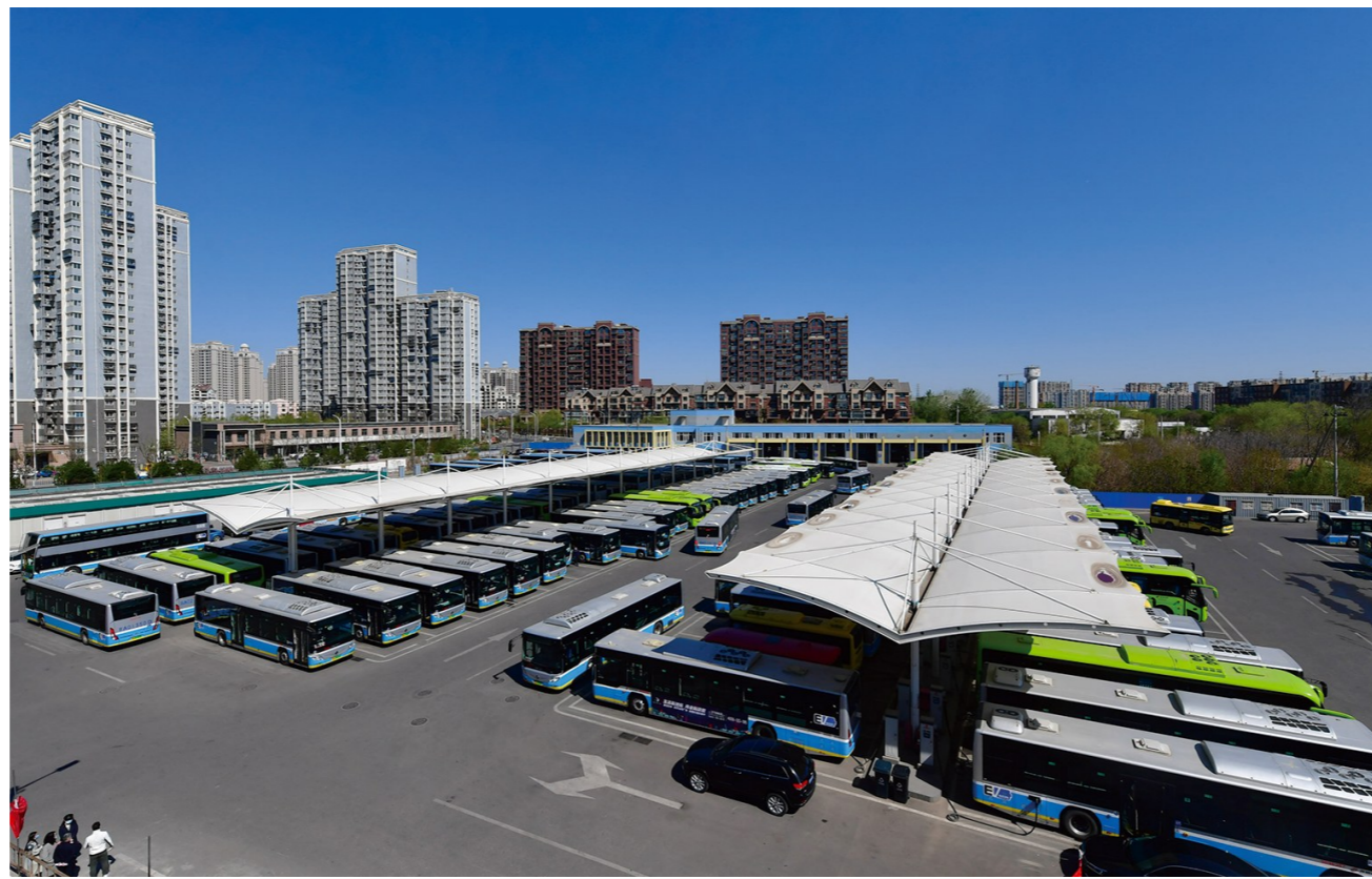
今年本市将推进通州与北三县公交信息共享,两地跨省通勤将更便捷。

对于备受关注的食品安全监管等重点领域突出问题,今年本市也将强化食品安全全链条监管,启动全市食品安全全链条数字化平台建设,打造人民群众放心满意的食品安全高