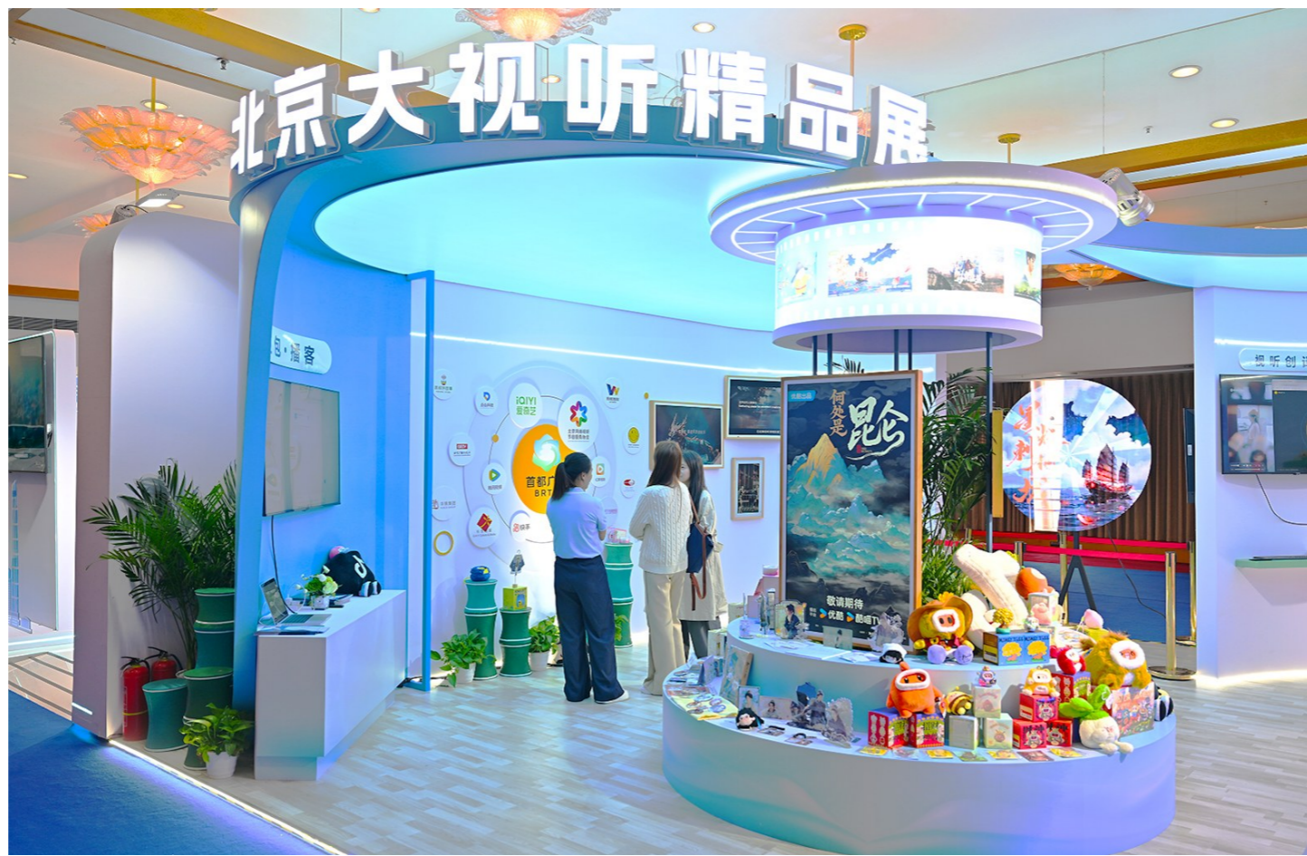
第二届北京大视听“追光计划”国际微短剧大赛启动,由通州区出品的微短剧进入业界视野。

而本次发布的第二届“追光计划”国际微短剧大赛将实现全面升级。在赛道设置层面,本届大赛紧扣社会关切与行业趋势,通过六大主题赛道开辟多元创作的新空间。“烟火中国·千行百业”致力于塑造具有现实质感的当代群像;“中华传统·文脉非遗”聚焦非遗技艺的创造性转化;“科创未来·科技叙事”探索科幻新范式;“京韵魅力·古都新景”展现北京现代气质与古都韵味的同框共生;“壮丽山河·文旅风潮”旨在将地方资源转化为可共情的叙事;“国际万象·视野无界”则着力推动文明互鉴。大赛力求通过这些细分赛道,以新大众文艺激发全民创作活力,将分散的个体表达组织起来,把社会创作热情转化为体系化的高质量供给,推动微短剧向文化精品跨越。