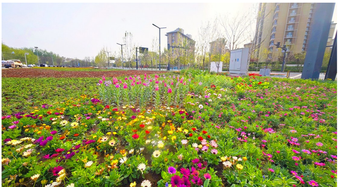
马拉松跑者将穿行于花卉景观之间,沉浸式感受美丽赛道。

本报讯(记者 张嘉祥)2026北京城市副中心马拉松将于4月19日鸣枪开跑。赛事路线途经潞城区域内,涉及运河东大街、春明西路、胡郎路、潞城中路、厂通路等多条主要道路。连日来,潞城镇以“举全镇之力护航赛事”为目标全面开展保障工作,力争在赛事期间展现副中心后花园的生态魅力与文明风貌。