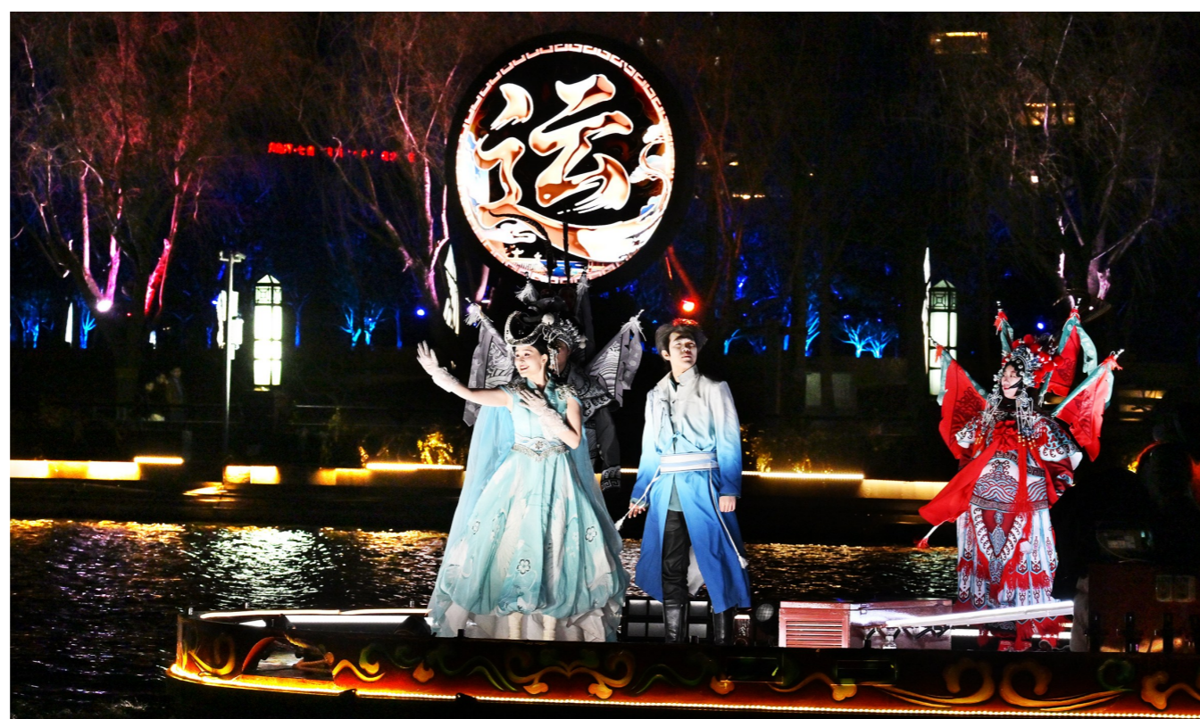
活动现场,各类演出趣味十足。

后续票价将分阶段执行:五一黄金周正价成人198元/人,儿童99元/人,并推出家庭套票;5月6日至15日为早鸟第