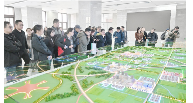
种业从业者齐聚一堂参观种业园区。记者 常鸣/摄

本报讯(记者 田兆玉)近日,北京种业创新服务赋能大会暨通州国际种业园开放日活动圆满收官。这场以“科技赋能种业振兴·平台助力创新提速”为主题的盛会,不仅吸引了首都种业全产业链超百名核心从业者齐聚,更一举促成 10 余家北京属地种业企业达成 20 项合作意向,在分子检测、育种技术研发等领域实现创新资源与产业需求的精准匹配,为北京“种业之都”建设注入强劲动力。