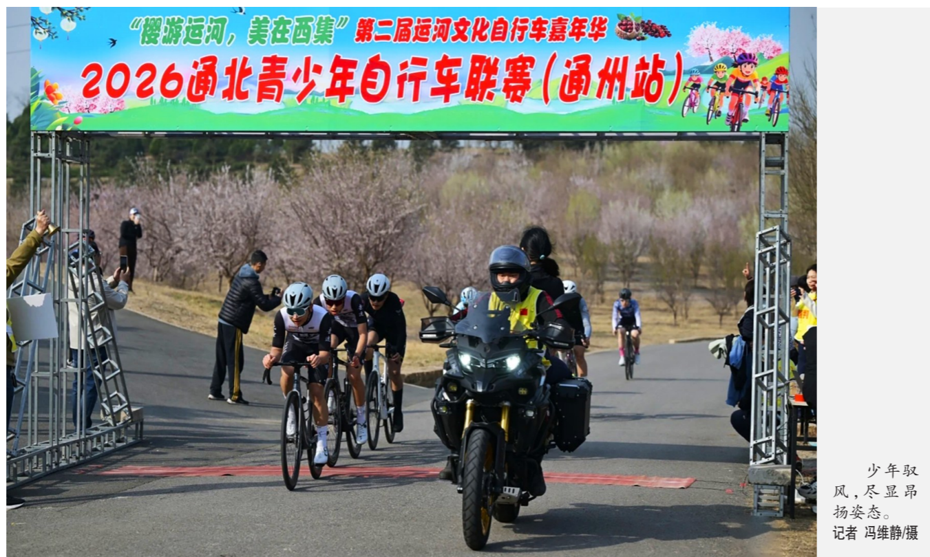
少年取风,尽显昂扬姿态。

赛场上,青春力量澎湃涌动,竞技氛围热烈浓厚。来自北京、河北北三县、天津、成都、合肥、辽宁辽阳等地的青少年骑手同台竞技,其中既有熟悉赛道、稳扎稳打的本土选手,尽显主场锋芒;也有远