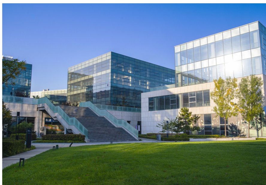
紫光VID网络视听产业园区内部场景。

当前,工作人员正加紧开展线路站点勘察、车辆调度优化、运行时刻表编制等具体工作,全力以赴确保通勤班车按