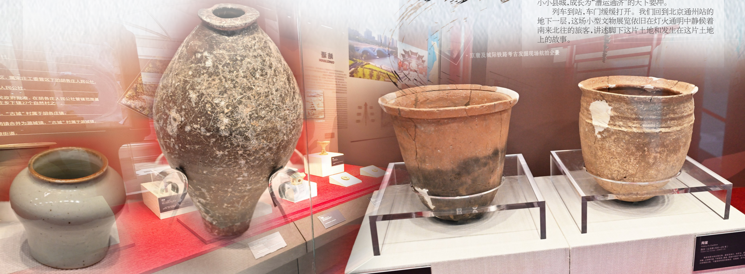
京唐及城际铁路考古发掘现场航拍全景