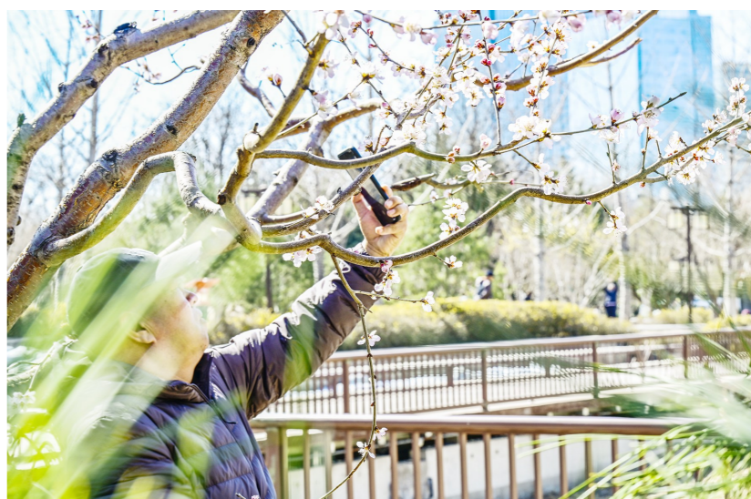
定格大运河春花儿,留住春花烂漫时。

本报讯(记者 石峰)春归大地铺锦色,花绽运河润芳华。今日,第八届“大运河春花儿”影像展征集活动正式启动。 本次活动由通州区文化和旅游局、北京发布、区委网信办、区文学艺术界联合会、区融媒体中心、天津市武清区文化和旅游局、河北省廊坊市文化广电和旅游局共同主办,以“光影里的运河春”为主题,开展“大运河春花儿”影像展作品征集活动。 活动至5月5日结束,要求影像拍摄时间为今年立春以后,内容可聚