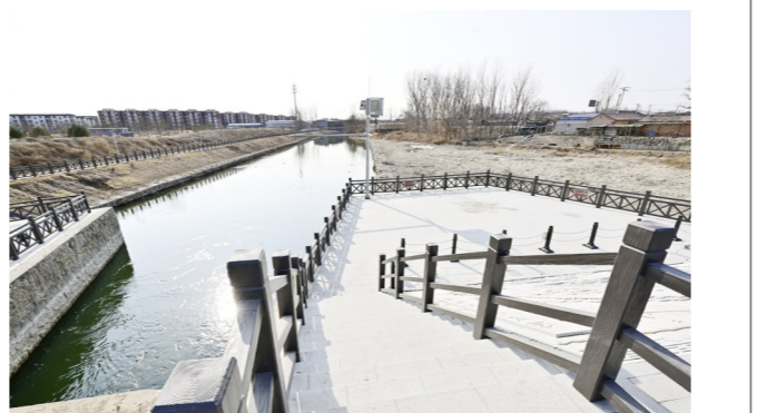
春季河道生态补水工作启动,沉寂一冬的河道重拾灵动与活力。