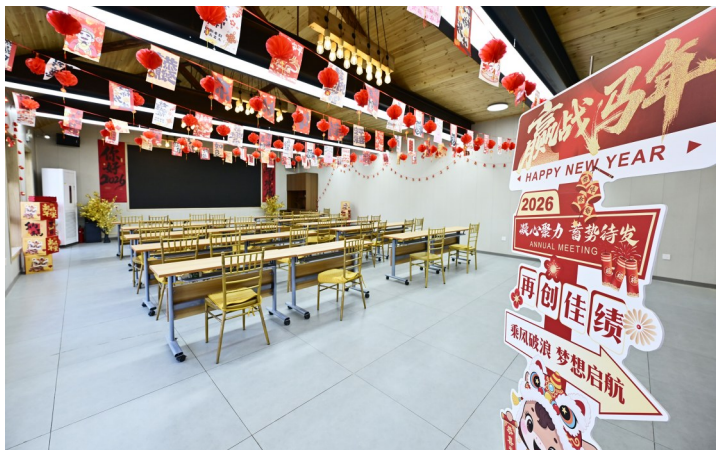
智慧教室内,提前布置好的学习区域整洁有序。

本报讯(记者 冯维静)寒假临近,“孩子没人带”“作业没人管”成了不少通州企业员工的烦心事。近日,记者实地探访通发人才公司推出的企业员工专属教育福利服务点,发现这里不仅有针对性地推出了寒假托管+特色入学转学一站式服务,更在师资、餐饮、安全等细节上做实准备,精准破解职工“带娃之忧”。据悉,这一福利的推出,源于此前对北汽集团、通州国际种业科技有限公司等多家单位的走访调研,员工集中反映的子女看护与就学问题,成为服务落地的核心动因。