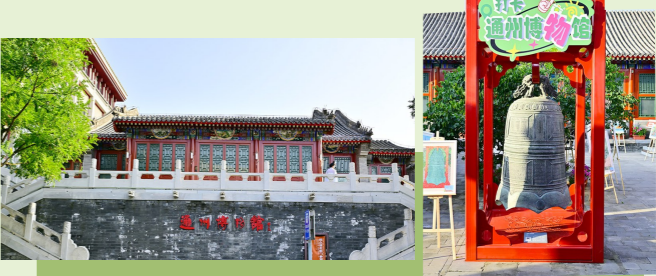
●文物与书香伴您跨年

主舞台将从19:30持续至24:00，电音、流行歌曲、马头琴演奏等节目轮番上演，还将穿插求婚告白与生日祝福环节；6个副舞台将同步开启“唱吧”体验与幽默表演。非遗灯韵、运河文创IP“河喜”、大运河音乐节吉祥物“GULU-LU”、舞狮、发光星河高跷等七大巡游队伍，将在20:00至23:30间四轮巡游，最终于零点前在大屏呈现终极表演。活动还设置了寓意美好的零点大奖，为新年送上满满惊喜。