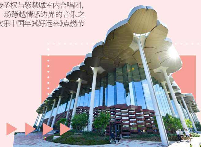
●城园新年活动暖意启幕

目前，演出门票火热开售中，诚邀市民走进艺术殿堂，在光影与乐声中，共度一个充满诗意与仪式感的元旦假期。