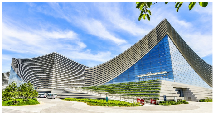
●重磅演出亮相北京艺术中心

运河潮起迎元旦，文韵流转贺新程。2026年元旦佳节，北京城市图书馆、北京大运河博物馆、北京艺术中心三大文化设施同步开启迎新模式，以书香浸润、文博探源、艺术盛宴三大主题矩阵，将传统雅韵与现代文化深度融合。从森林书苑的亲子共读、非遗展演，到运河之舟的沉船特展、文化漫游，再到文化粮仓的经典话剧、交响乐章，一场场覆盖全龄段、多维度的文化盛宴温暖上演，让市民游客在沉浸式体验中邂逅岁首美好，开启充满诗意的新年篇章。