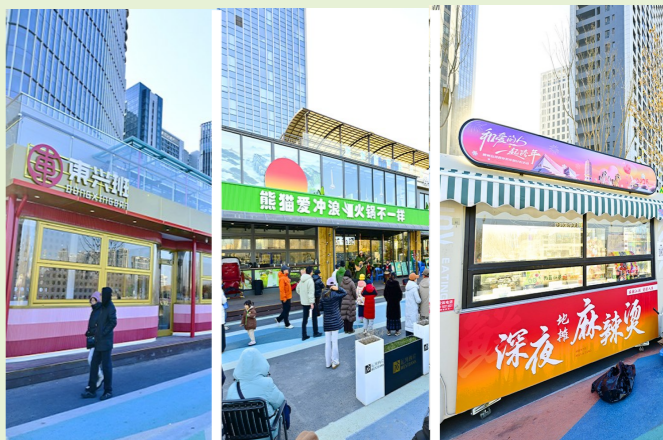
●运河西岸跨年盛宴活动多

今年的跨年夜和元旦假期，通州区还将举办多场主题活动，运河西岸的潮流跨年与温情互动，通州区博物馆的沉浸式文化体验，以及各大场馆的一系列展览、演出等活动，将满足不同年龄段市民群众的多元文化需求。