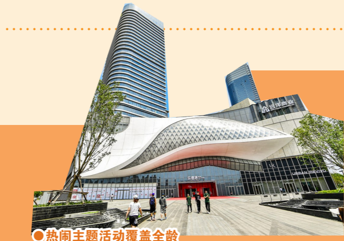
●热闹主题活动覆盖全龄

岁末年初，北京通州区各大商圈强势集结，以“跨年+元旦”为契机，推出覆盖购物优惠、亲子互动、文化演出、非遗体验的多元促消费活动。从2025年12月26日至2026年1月3日，通州北投爱琴海、首开通州万象汇、通州万达等核心商圈联动发力，用满减、抽奖、主题展演等多重福利，为市民打造沉浸式、一站式的假日消费盛宴，让年味与烟火气在商圈持续升温。