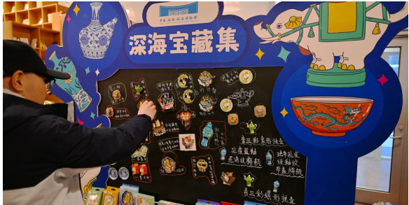
游客在挑选心仪的冰箱贴。

相关负责人介绍,展览开幕后已上新20余个品类共计215款文创产品,依托深海文物推出多款套系化冰箱贴,打破单一文物文创的局限,以“集群叙事”呈现海上贸