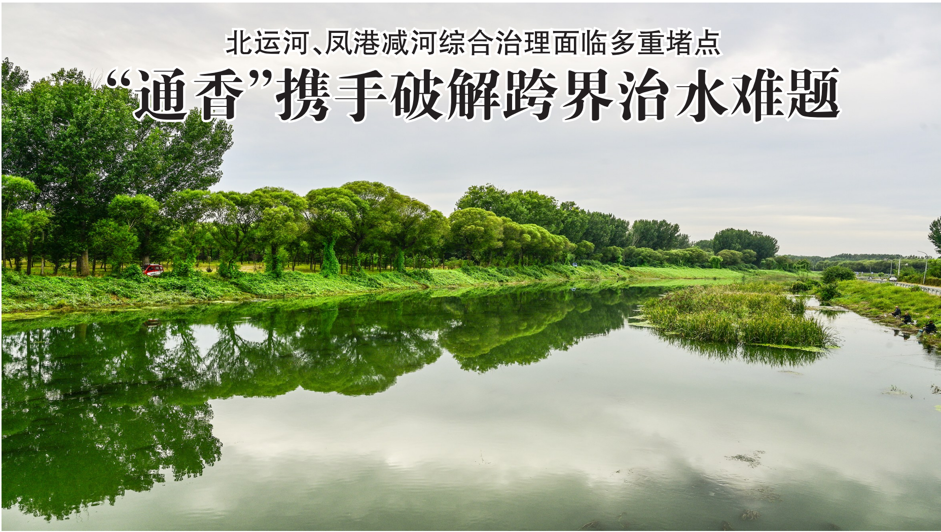
通州与香河携手破解治水难题,凤港减河治理成效显著,水清岸绿。

本报讯(记者 冯维静)“一衣带水,兄弟情深!”近日,一面印着感谢语的锦旗从香河县水务局送至通州区水务局,这面锦旗不仅见证了兩地在北京运河、凤港减河治理中的紧密协作,更标志着通州区水务局以“主动协同”理念践行京津冀协同发展战略,在跨界水务一体化治理中取得新突破。 据了解,北运河、凤港减河作为通州与香河的界河,其综合治理曾面临跨区域协调难、流程不互通、水流调控难等多重堵点。此前,香河县水务局在推进北运河治理征迁占地、燃气专线迁改等工作时,因跨区域基础信息匿