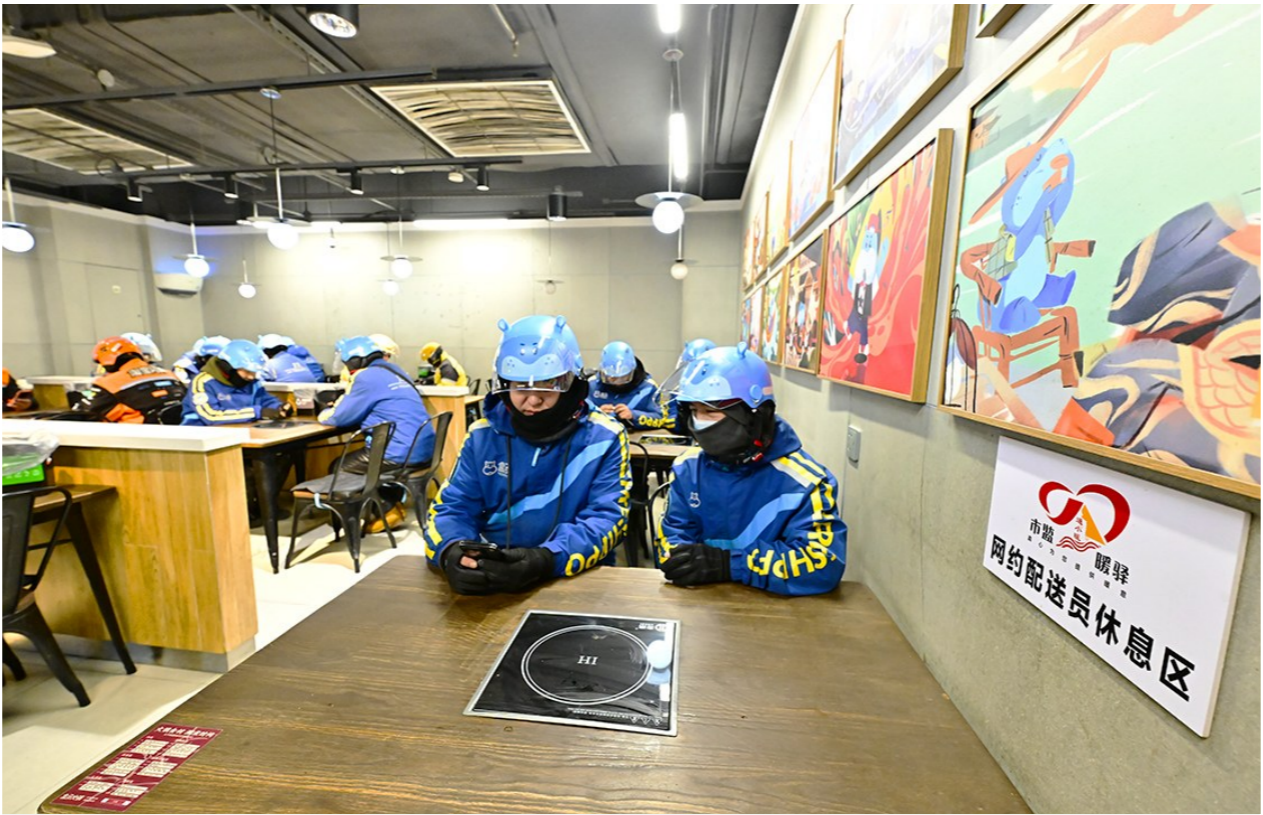
配送员们在盒马鲜生新华东街店的“通小暖”休息、聊天。

作为两部门联合挂牌的首批标杆驿站,盒马鲜生新华东街店每天要接待近百名骑手,日均2000单的外送量,让这里成为骑手们的“高频打卡地”,也成为两部门联合服务群众的“鲜活样板”。“驿站不是‘摆设’,要让每一位户外劳动者都能用上、用得舒心。”两部门负责人表示,接下来,他们将继续深化联合协作,联动商圈商户搭建“资源共享、服务共建”机制,不光要把现有服务做细做实,还会新增法规咨询、技能培训等服务,同时引导骑手们参与商圈治理,让“通小暖”驿站既成为劳动者的“歇脚点”,也成为商圈文明的“加油站”,用部门协同的“合力”,传递城市副中心的“暖意”,让户外劳动者在奔波中收获归属感、幸福感。