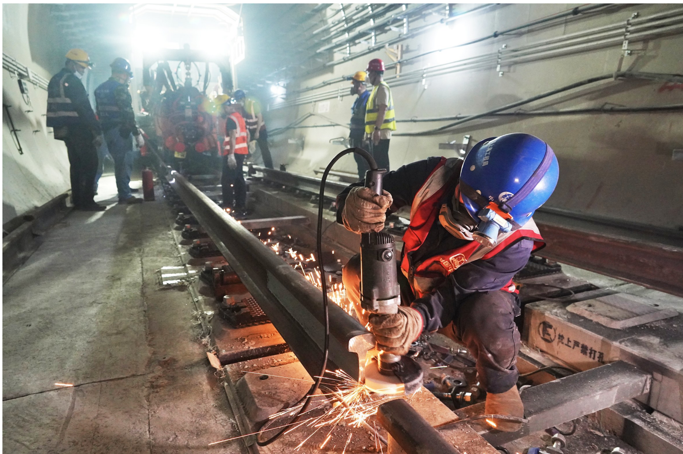
地铁17号线中段永安里站“长轨通”。

17号线中段开通将连接已通车的南段和北段,串联起天通苑、望京西、太阳宫、潘家园等居住区,大幅缩短亦庄、天通苑等外围新城与中心城区、首都功能核心区的时空距离,促进亦庄新城、未来科学城等外围组团的发展,成为北京东部区域南北向高速交通大动脉,也将显著增强CBD、使馆区、朝阳门外等成熟功能区的交通可达性。