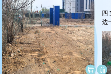
马驹桥镇崔平路与四支路南段交汇处周边-积存垃圾