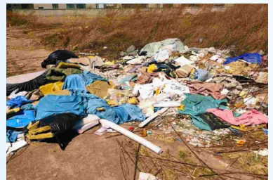
宋庄镇徐宋东四街与通环路交叉口西100米路北-积存垃圾