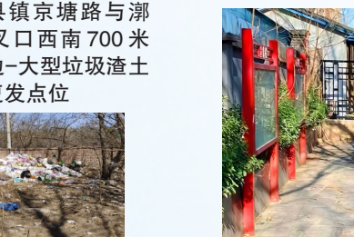
九棵树街道翠屏东路德盛康大药房东侧-积存垃圾