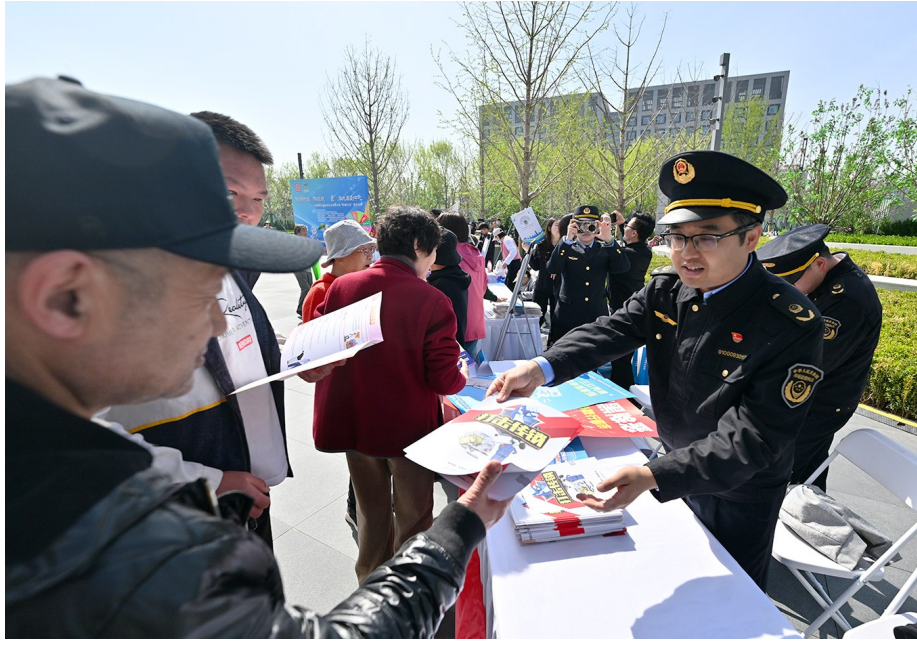
市场监管局工作人员向市民分发宣传册。