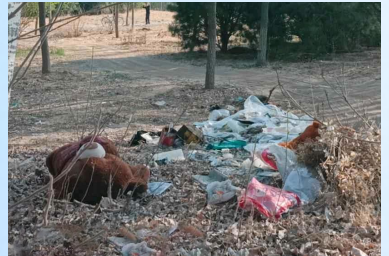
西集镇孝行东路东距三哥烤羊腿421米处-积存垃圾