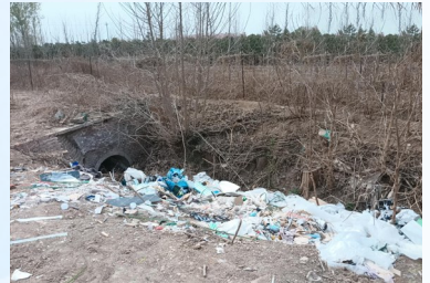
永乐店镇陈辛庄距陈辛庄路约208米,距港沟河约484米-大型垃圾渣土堆放点复发点位