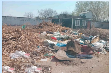
潞城镇榆武路与前榆路交汇处向东北约150米处-积存垃圾