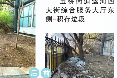
玉桥街道运河西大街综合服务大厅东侧-积存垃圾