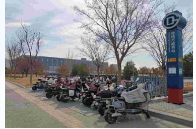
文景街道万盛南街与振馨四巷交叉口东南角-非机动车乱停放