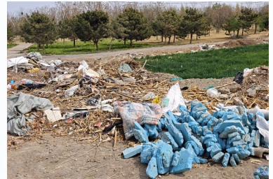
张家湾镇大辛庄村距辛庄村环路约170米,距凉水河约651米-大型垃圾渣土堆放点复发点位