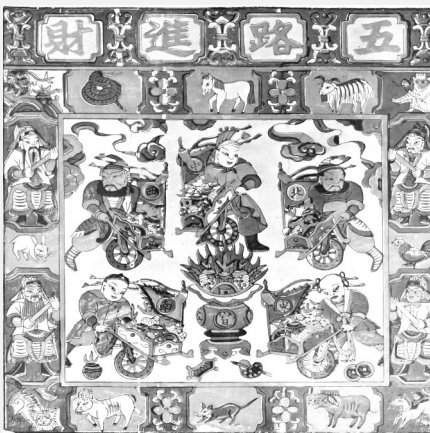
《五路进财》 喜迎五路财神， 寓意财源广进。