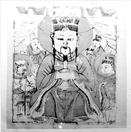
北京特色年画 纸马。