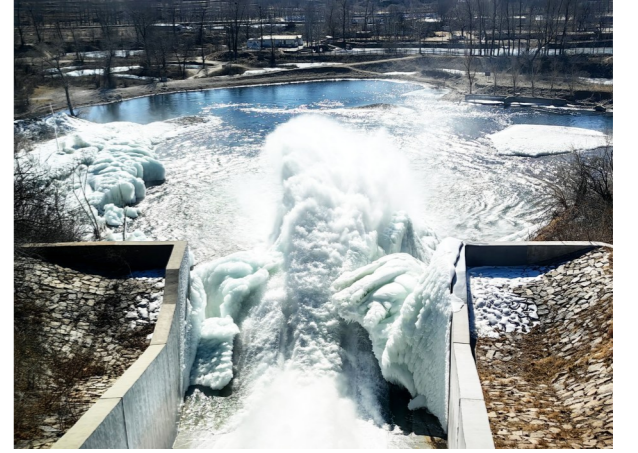
密云水库加大出库流量。

5.2%、5.1%、5.4%——2024年，京津冀三地的经济增速均高于全国平均水平，区域地区生产总值为11.5万亿元，这一数字是2023年的2.1倍。倘若向前回溯，协同发展的这11年，京津冀经济总量已经连跨6个万亿元台阶。增长曲线的背后是京津冀城市群的格局之变，现代化首都都市圈建设全面提速，重点领域协同发展亮点纷呈，重点区域一体化发展不断深入，三地优势互补、相互赋能，协同发展呈现新气象。