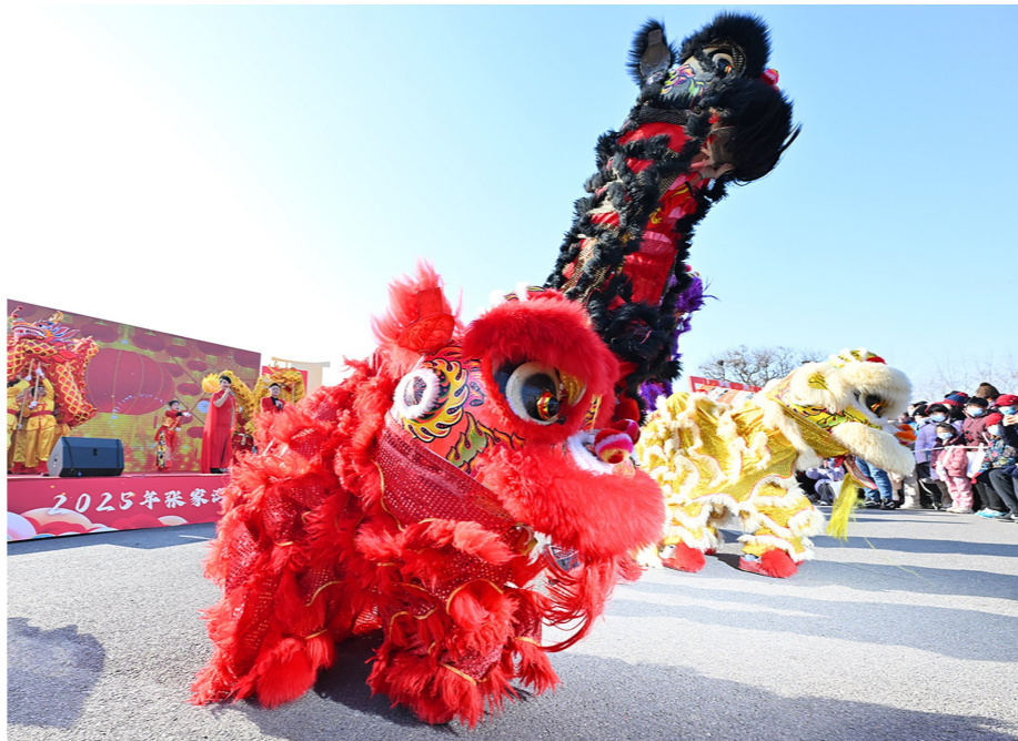
舞狮舞龙轮番登场,文艺演出喜气洋洋。

吴先生抱着一岁半的孩子来到了大集,“我爱人是张家湾人,这次看到活动信息,想着带孩子回姥姥家感受一下过节的气氛,认识认识非遗技艺,让他从小就建立起对中华优秀传统文化的归属感。”“看到了很多小时候才有的传统节目,让我们重温了儿时的记忆。”家住周边,和家人一起前来的杨女士告诉记者,今年过年,她印象最深的就是“运河大集”,西集大集、永乐店大集、漷县大集,每一个都有着浓郁的烟火气。