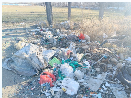
漷县镇毓庄村距凉水河左堤路约185米，距凉水河约265米-大型垃圾渣土堆放点复发点位