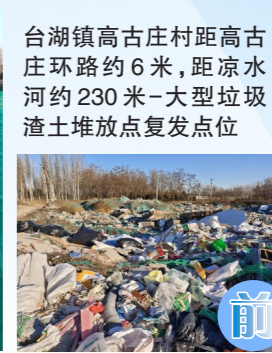
台湖镇高古庄村距高古庄环路约6米，距凉水河约230米-大型垃圾渣土堆放点复发点位