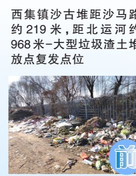
西集镇沙古堆距沙马路约219米，距北运河约968米-大型垃圾渣土堆放点复发点位