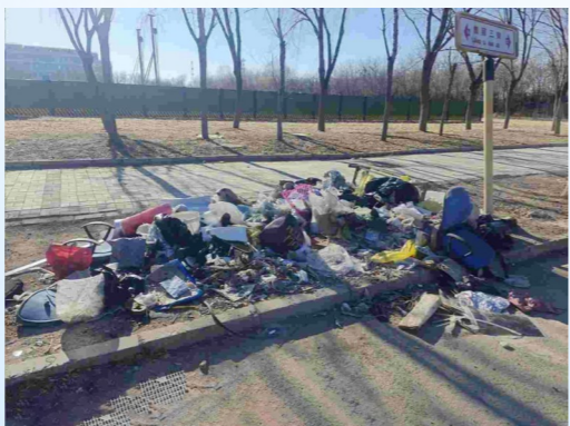
西集镇靓丽三街与创益中路交叉口东120米路南-积存垃圾