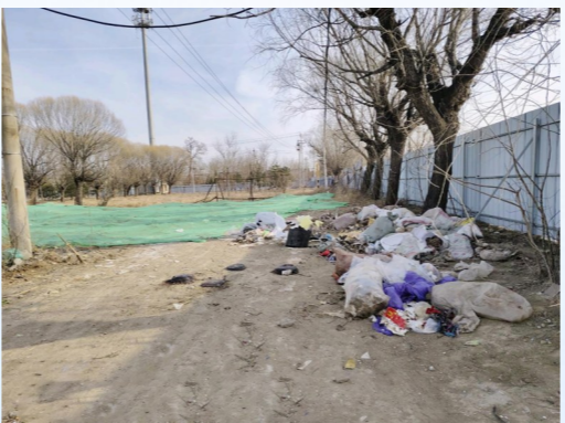
张家湾镇张凤路张湾大集对面-积存垃圾