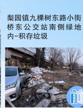
梨园镇九棵树东路小街桥东公交站南侧绿地内-积存垃圾