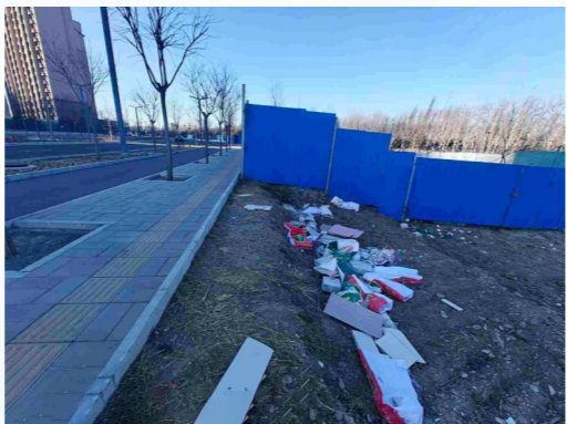
潞城镇运河南路后北营家园1区-6号楼东侧-积存垃圾