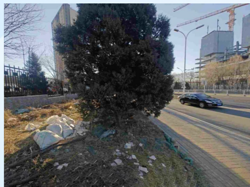
通运街道紫运中路与运河东大街交叉口东北侧-积存垃圾