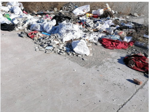
宋庄镇小堡村距小堡工业区环路约11米，距中坝河约753米-大型垃圾渣土堆放点复发点位