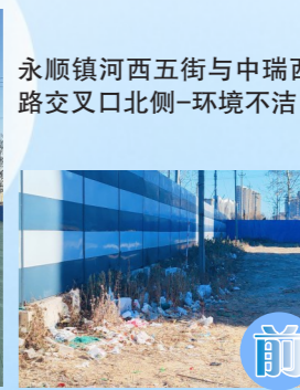
永顺镇河西五街与中瑞西路交叉口北侧-环境不洁