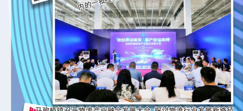
马驹桥镇召开物流产业融合发展大会，探讨物流行业发展新路径。