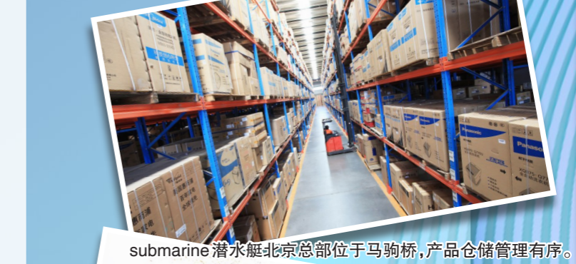
submarine潜水艇北京总部位于马驹桥，产品仓储管理有序。