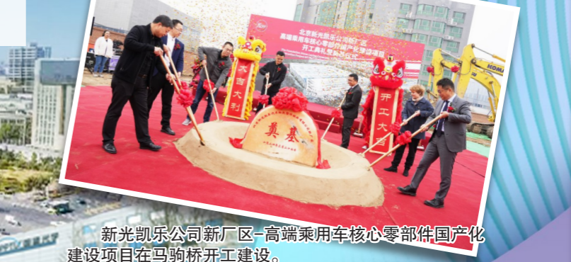
新光凯乐公司新厂区—高端乘用车核心零部件国产化建设项目在马驹桥开工建设。