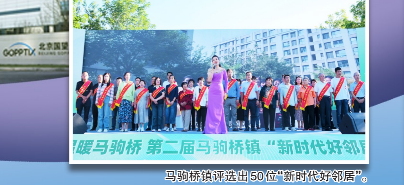
暖马驹桥 第二届马驹桥镇“新时代好邻居”评选颁奖仪式。