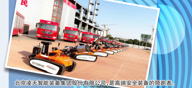
北京凌天智能装备集团股份有限公司，是高端安全装备的领跑者。