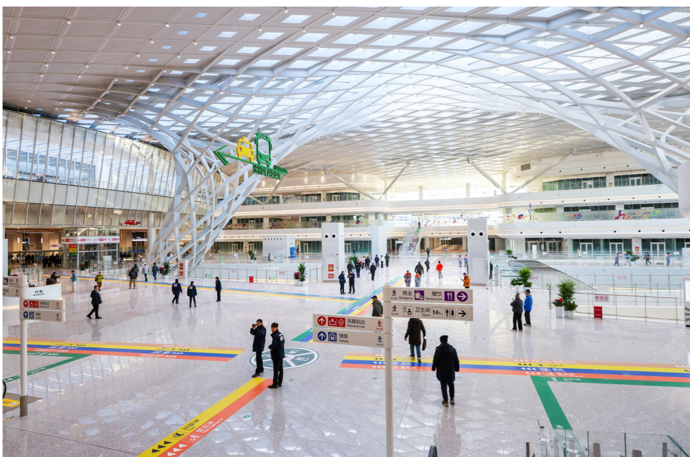
随着地铁3号线开通,北京朝阳站枢纽同步启用,大批市民前来打卡。