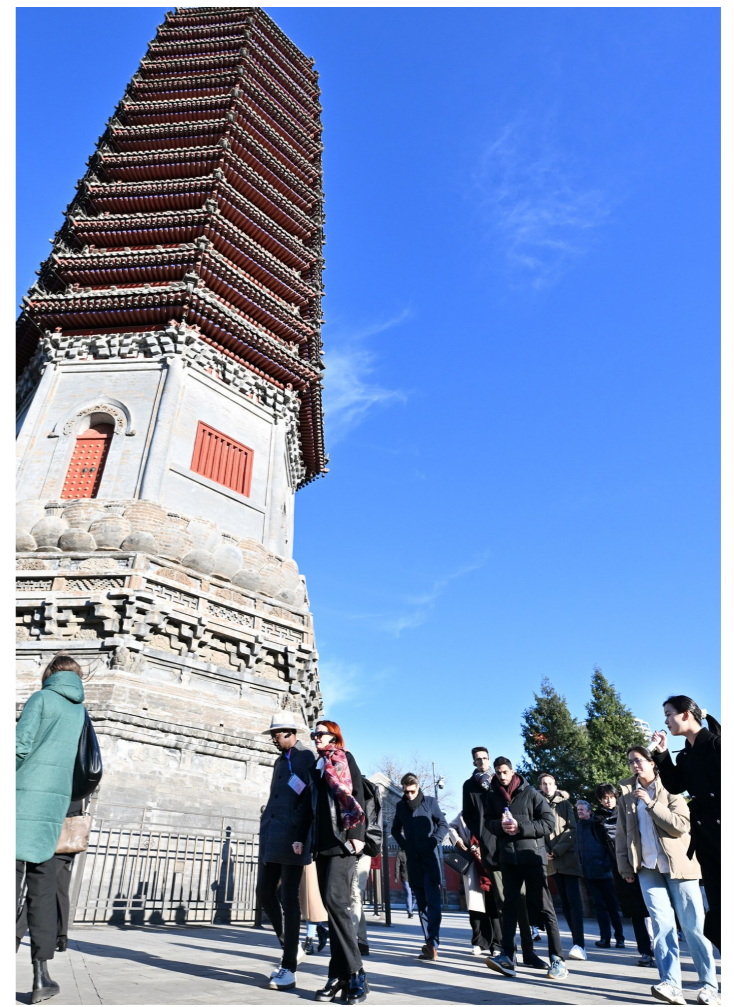
国际青年代表在燃灯塔下感受大运河历史底蕴。

本报讯(记者 孙云柯 池阳)作为2024“国际青年领袖对话”项目年度论坛的配套活动,昨天,来自国内外各领域的20多名杰出青年代表来到通州区开展研学。大家在燃灯塔下感受大运河的历史底蕴,在北京城市图书馆中参观学习、交流思想,亲身感受北京城市副中心近年来取得的新发展、新变化、新成就。