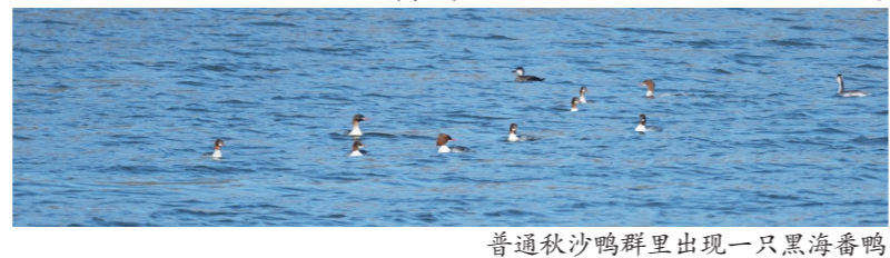
普通秋沙鸭群中出现一只黑海番鸭