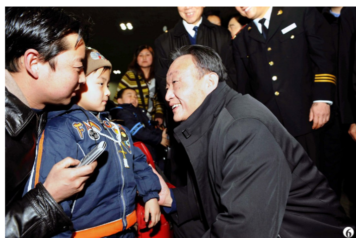
图6:2008年2月3日,吴邦国同志在北京西站候车室与旅客交谈。