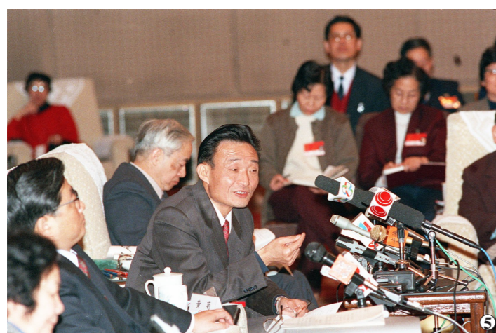
图5:1994年3月,时任上海市委书记的吴邦国同志在全国两会上海代表团全团会议上。

吴邦国同志是中国特色社会主义民主政治建设的重要领导者。他强调,如果没有比较完备、高质量的法律法规,就谈不上依法治国,建设社会主义法治国家。在党中央领导下,他将立法工作作为全国人大及其常委会的首要任务,紧紧围绕党中央确定的立法工作目标,坚持科学立法、民主立法,适应社会主义市场经济发展、社会全面进步和加入世贸组织的新形势,把中国特色社会主义法律体系中基本的、急需的、条件成熟的法律作为立法重点,抓紧制定修改相关法律,集中开展法律清理工作。2003年3月,他担任中央宪政修改小组组长,在中央政治局常委会领导下主持宪法修改工作。由十届全国人大二次会议通过的宪法修正案,确立了“三个代表”重要思想在国家政治和社会生活中的指导地位,明确国家尊重和保障人权、依法保护公民的私有财产权和继承权等内容,对促进我国经济社会发展、推进中国特色社会主义民主法治建设具有重要意义。在他的主持下,第十届、十一届全国人大及其常委会共审议通过宪法修正案草案、法律草案、法律解释草案和有关法律问题的决定草案186件,包括物权法、企业破产法、企业所得税法、公务员法、行政许可法、治安管理处罚法、劳动合同法、未成年人保护法、妇女权益保障法、关于加强网络信息保护的决定等。在党中央领导下,他主持制定反分裂国家法,把党和国家对台工作的大政方针和政策措施以法律形式固定下来,为反对和遏制“台独”分裂活动、促进祖国和平统一提供有力法律保障。他主持对香港特别行政区基本法、澳门特别行政区基本法及其附件有关条款作出解释并通过相关决定,推动两个基本法正确实施和“一国两制”方针贯彻落实。他主持制定修改一系列对中国特色社会主义事业具有重大影响的法律,为推动形成中国特色社会主义法律体系作出重要贡献。(下转3版)