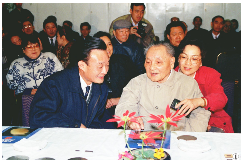
图1:1992年2月10日,邓小平同志在上海贝岭微电子制造有限公司参观时与吴邦国同志交谈。