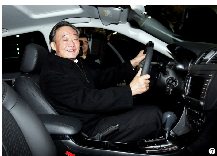
图7:2010年1月30日,吴邦国同志在上海汽车集团股份有限公司技术中心察看新能源车。