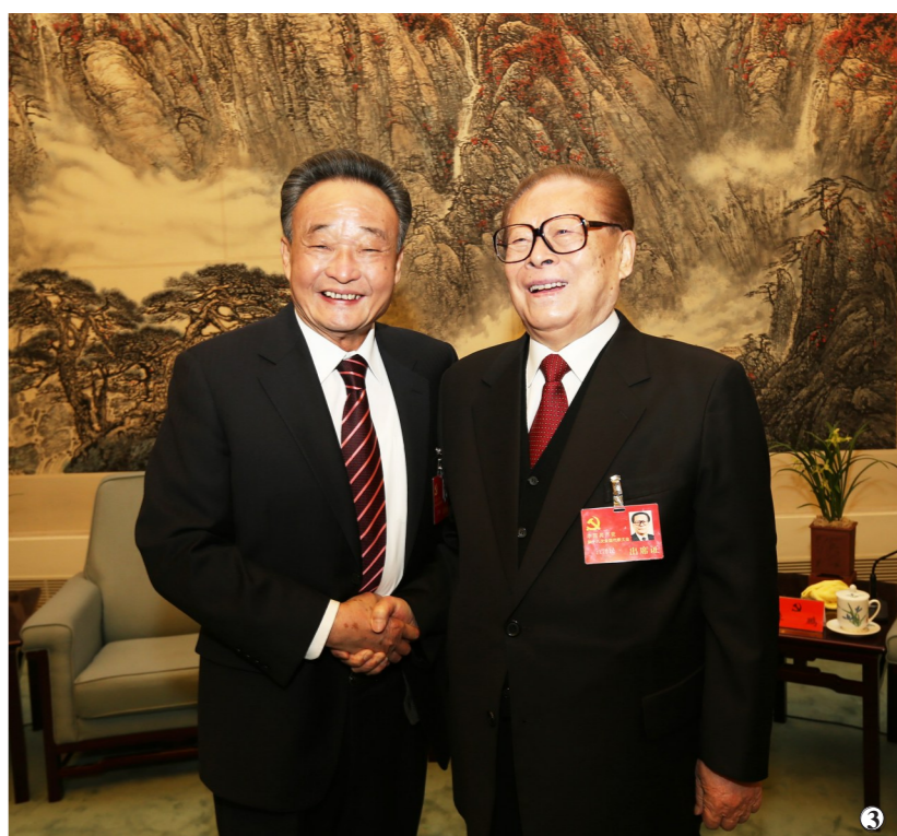
图3:2012年11月14日,中国共产党第十八次全国代表大会在北京闭幕。这是闭幕会前,江泽民同志与吴邦国同志在一起。