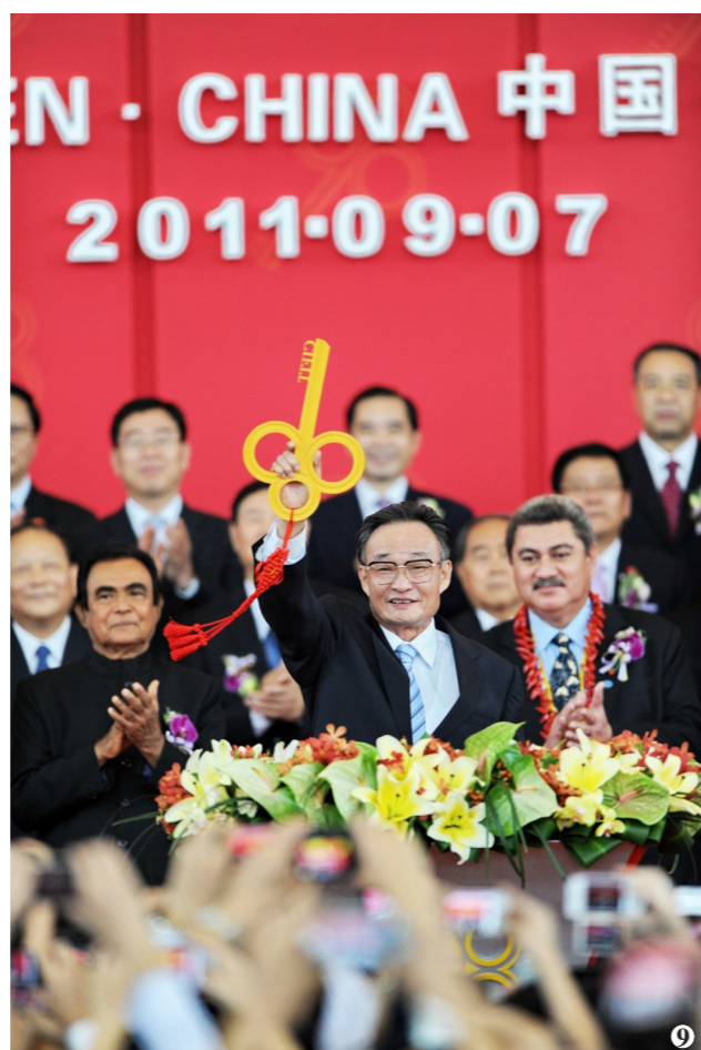
图9:二〇一一年九月七日,吴邦国同志在福建厦门出席第十五届中国国际投资贸易洽谈会开幕式。