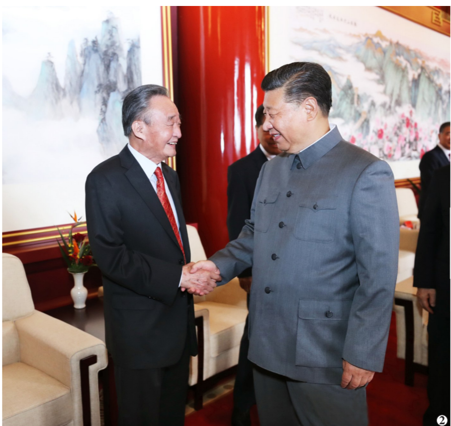
图2:2021年7月1日,庆祝中国共产党成立100周年大会在北京天安门广场隆重举行。这是庆祝大会前,习近平同志与吴邦国同志握手。