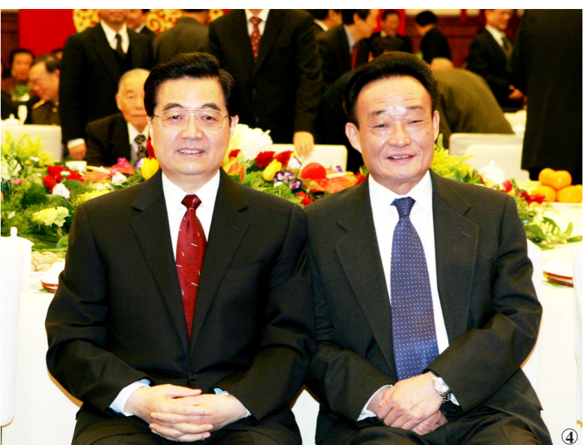
图4:二〇〇五年一月一日,全国政协在北京举行新年茶话会。这是胡锦涛同志与吴邦国同志在一起。

中国共产党的优秀党员,久经考验的忠诚的共产主义战士,杰出的无产阶级革命家、政治家、党和国家的卓越领导人,中国共产党第十四届中央政治局委员、中央书记处书记,第十五届中央政治局委员,第十六届、十七届中央政治局常委,国务院原副总理,第十届、十一届全国人大常委会委员长吴邦国同志,因病医治无效,于2024年10月8日4时36分在北京逝世,享年84岁。