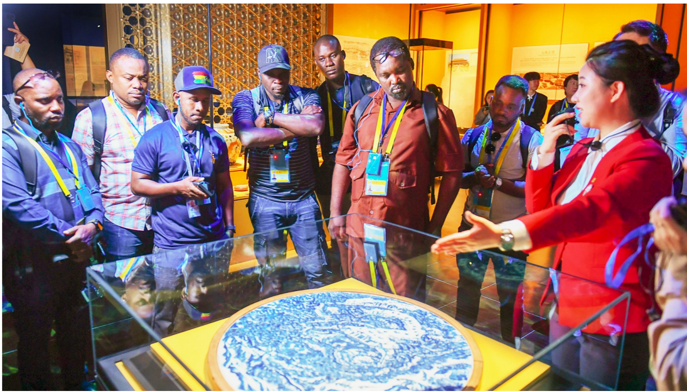
外国记者参观北京大运河博物馆。

记者得知,北京大运河博物馆不仅是北京建设“博物馆之城”和大运河文化带的龙头工程,更是推动京津冀协同发展