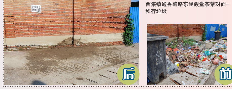
西集镇通香路东涵源堂茶业对面-积存垃圾