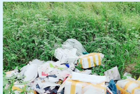
杨庄街道黄瓜园街与杨庄路交叉口西160米路南-积存垃圾