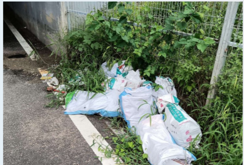
潞源街道崇善中街东六环桥下-积存垃圾