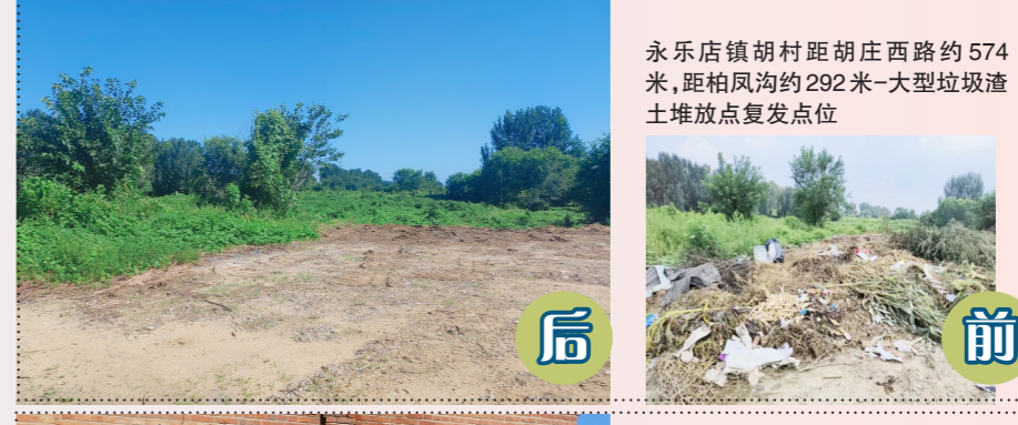
永乐店镇胡村距胡庄西路约574米,距柏凤沟约292米-大型垃圾渣土堆放点复发点位