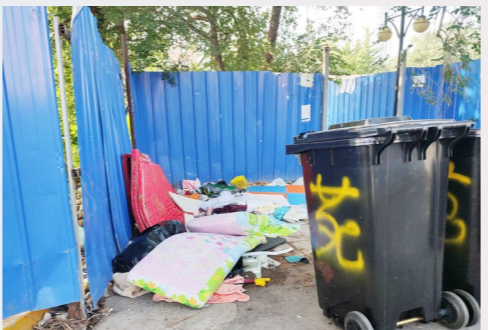
北苑街道环惠南二街与新华北路交叉口向西150米-积存垃圾