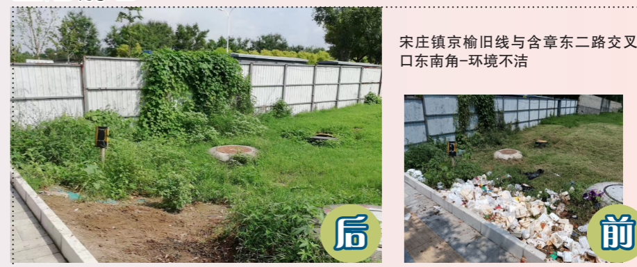
宋庄镇京榆旧线与含章东二路交叉口东南角-环境不洁