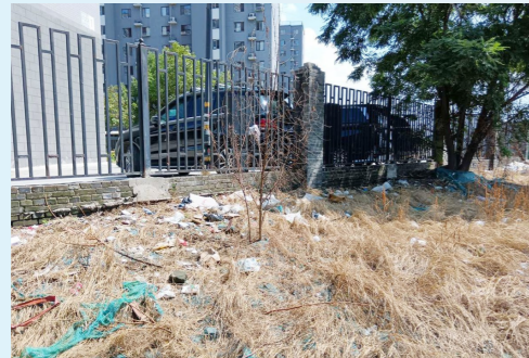
宋庄镇六合新村北侧路六合新村北区西北角-环境不洁