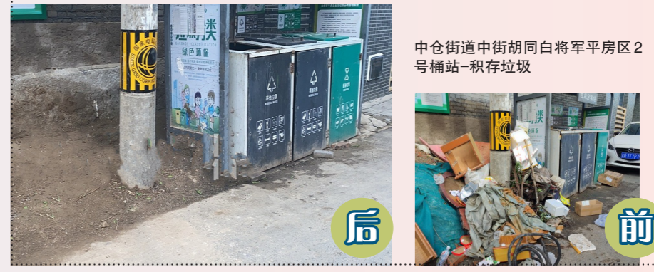
中仓街道中街胡同同将军平房区2号桶站-积存垃圾