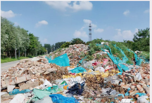
台湖镇蒋辛庄村距蒋辛庄村内路约0米,距凉水河约2388米-大型垃圾渣土堆放点复发点位