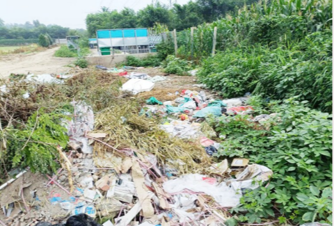
潞源县吴营村距吴营环路约464米,距凉水河约321米-大型垃圾渣土堆放点复发点位