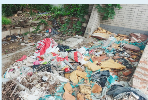
张家湾镇张采路张家湾公交站南70米路东-积存垃圾