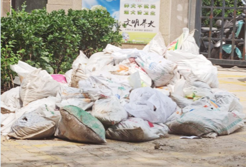
通运街道运河园路K2百合湾西区西门-堆物堆料