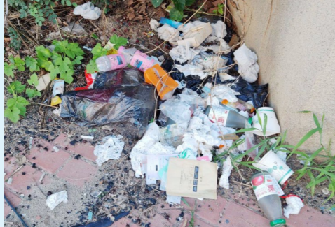
西集镇仪成路与七星北街交叉口西北角-积存垃圾