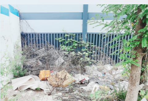
文景街道曹园北街与振鹭一巷交叉口西南角-积存垃圾