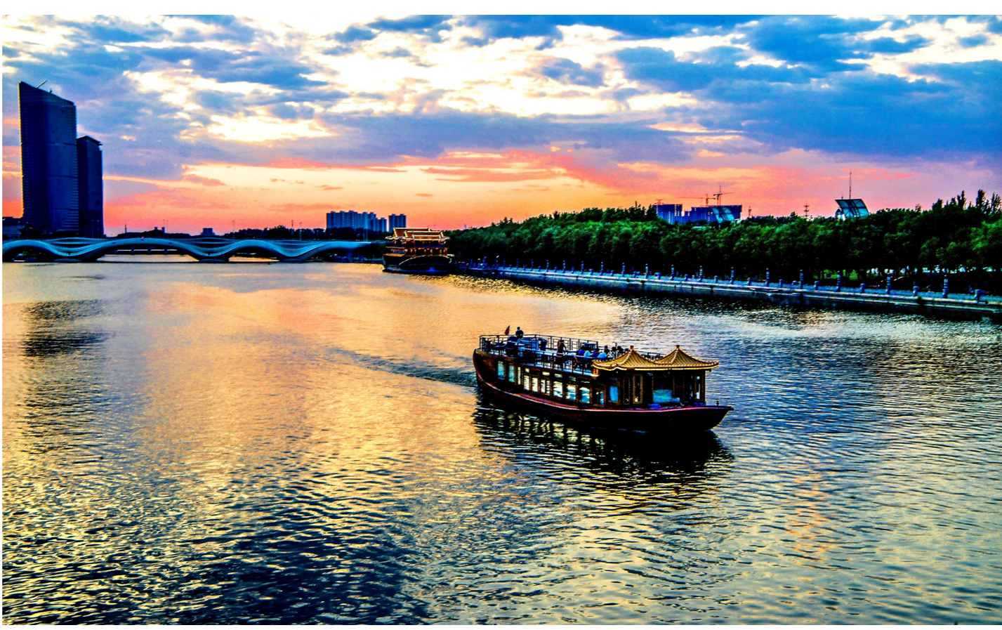
大运河文化旅游景区规模初显,依托景区,未来将开展更多文旅项目。记者 唐建/摄

栽下梧桐树,引得凤凰来。在通州区文旅局的多措并举下,多家文旅企业落地副中心。记者了解到,上半年全区文旅板块共引入企业224家,注册资本约9.3亿元,