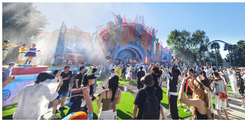
暑期旺季,环球影城人气火爆。

城市副中心进一步优化产业政策,制定出台了《关于加快推进北京城市副中心高质量发展的若干措施》,准备拿出10亿元作为产业扶持资金,50万平方米作为新兴产业的空间,从资金支持、空间供给、营商环境、人才服务等多维度全方位助力企业共享城市副中心发展的红利,全力打造综合成本最低、审批效率最高、行政服务最好的