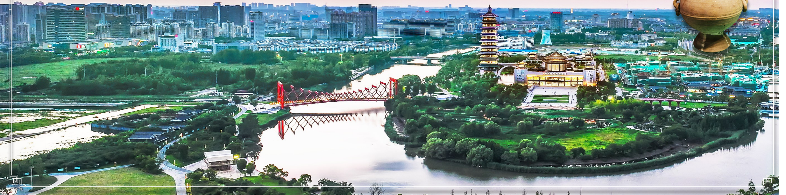
路县故城遗址陶壶