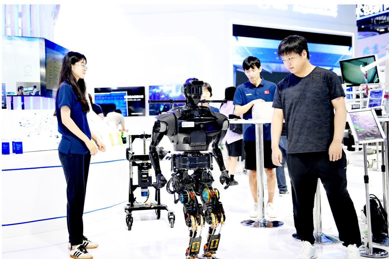
科博会展现场,人形机器人吸引观众观看。

今年初,工信部等七部门发布《关于推动未来产业创新发展的实施意见》,重点在未来制造、未来信息、未来材料、未来能源、未来空间、未来健康等六大方向谋划部署未来产业发展。