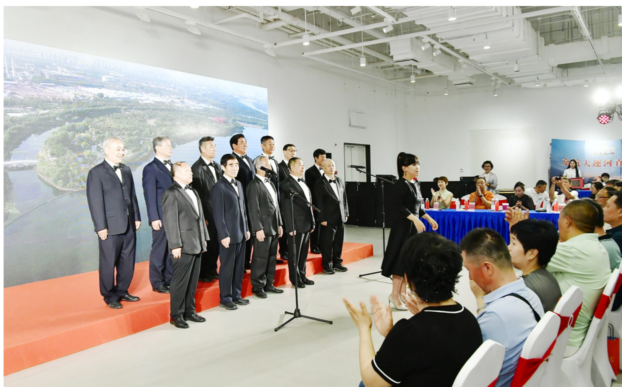
大运河诗词歌赋海选大赛现场。

合作，为观众带来视听盛宴，对悠久运河文化的经典演绎在观众心中种下了传承和弘扬运河文化的种子，也是推动通州区文艺事业高质量发展的重要举措。下一步，区文联将继续探索更多形式的文艺活动，深入挖掘运河文化丰富内涵，为通州区注入文艺新活力。