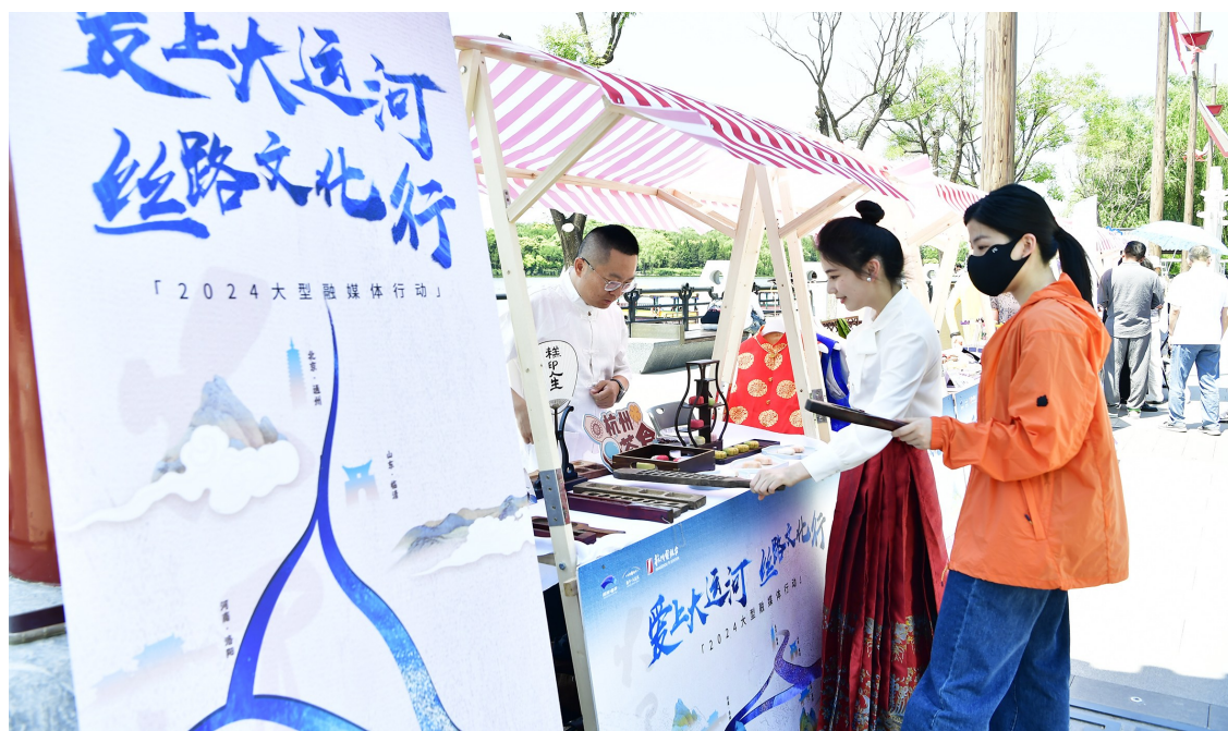
市集现场,京杭两地非遗文化汇聚,市民游客热闹“集”。

本报讯(记者 王倚剑)今年是中国大运河申遗成功10周年。日前,2024年“爱上大运河 丝路文化行”大型融媒体行动(以下简称“爱上大运河”活动)启动,第二站来到北京通州。