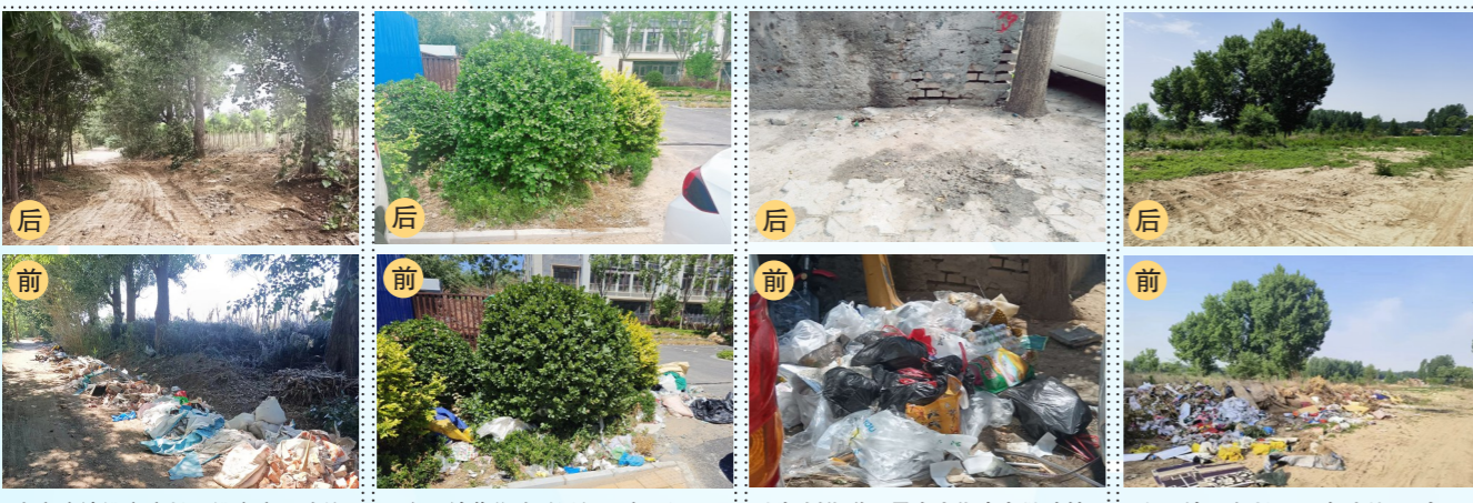
张家湾镇姚辛庄村距姚辛庄西路约11米,距凉水河约1187米一大型垃圾渣土堆放点复发点位;永顺镇范焦路西侧北仪阁北门外一积存垃圾;九棵树街道云景南大街青岛散啤精酿酒对面一积存垃圾;潞县镇西鲁村距西鲁路约71米,距凤港减河约678米一大型垃圾渣土堆放点复发点位