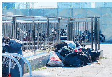
新华街道盐滩路小馋猫炸串店右前方绿化带周边一垃圾乱堆乱放