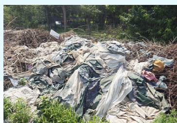
宋庄镇通燕高速南侧与潮白河大堤路交叉口西南侧一垃圾乱堆乱放