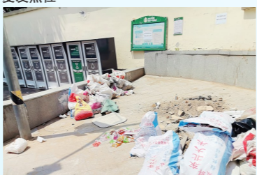
中仓街道南关东路生活垃圾分类投放点旁一积存垃圾