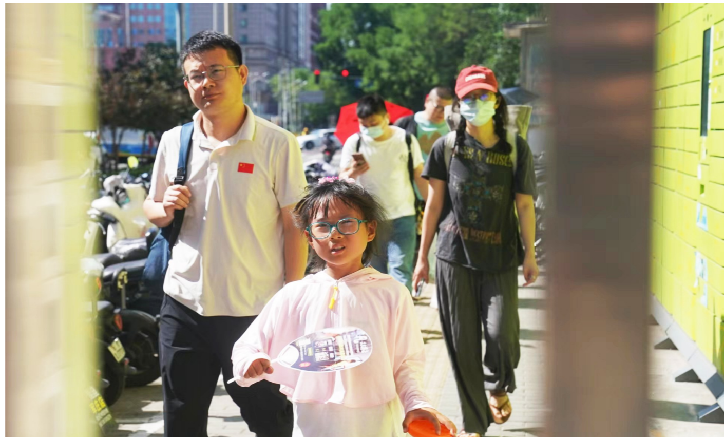
昨日高温橙色预警中的北京街头,人们用着各种办法躲避强烈阳光。

气象部门提醒,今明天高温橙色预警仍持续生效,大家外出注意防暑防晒补水;户外作业人员需谨防热射病等重度中暑疾病,老弱病幼人群及中小学生午后高温时段尽量避免户外活动。