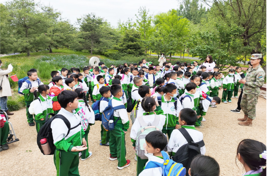
教官教给孩子们生存技能。