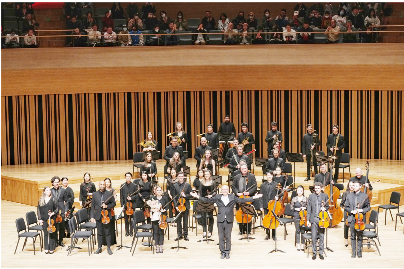
韦尔比耶音乐节管弦乐团登台北京艺术中心。

面向世界的同时,躬耕立足之本,深掘传统文化是北京舞台上另一条不变的主线。4月3日至6日,吉祥大戏院叫好连连,《生死恨》《玉堂春》《贵妃醉酒》《奇双会》《穆柯寨》《穆天王·大破天门阵》5场梅派经典剧目演出尽显梅派艺术的华光与传承,掀起“纪念梅兰芳先生诞辰130周年·梅葆玖先生诞辰90周年”系列活动首轮巡演的高潮;采编民族音乐经典的国家大剧院第二届“国乐之春”持续推