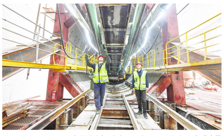
工人在盾构机内部检查其运行状态，确保顺利掘进。记者 常鸣/摄

其中最具挑战性的，就是特级风险源。该风险源的难题是盾构机需要下穿6号线地铁的出入段线，距离正常运行着的地铁轨道最近只有6米，施工难度大，对精细度要求更高。施工团队迎难而上，已经详细分析了各个风险源的问题，提出了专项施工方案和应急预案，做好了充足的准备。