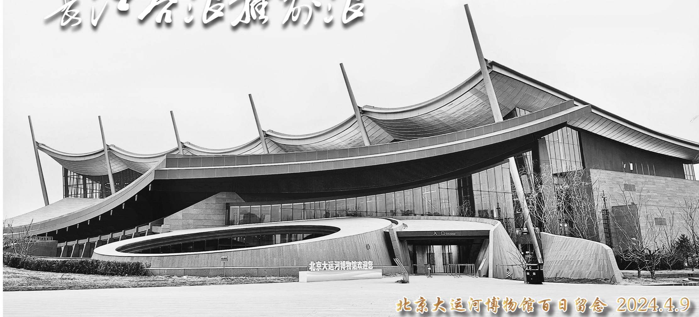
北京大运河博物馆百日留念 2024.4.9