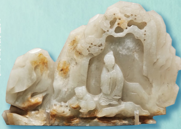
玉雕松下高士山子

比如一件清乾隆年间的玉雕松下高士山子，该文物的中间位置是一名拂袖而坐的高士，他的头扭向一旁看着旁边蹲在地上游玩的童子。而在高士和童子的身后是用玉雕出的高山与松树，雕刻者巧妙地将这块玉石的皮色，放置在该文物中松树的树枝和高山之上，整体看上去十分逼真。而另一件清乾隆年间的玉雕福寿海山子整体呈圆形，较松下高士山子小一些。该文物通过在玉石周身雕刻大海纹、高山纹等纹饰，展现福如东海、寿比南山的美好祝愿。