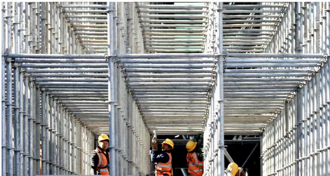
北京首座地下立交——土桥立交正在加紧施工,东六环改造全部工程预计年底竣工。

走在施工基坑内,地面的沙土格外松软,让人感觉仿佛走在了沙滩上一般。“其实,从‘土桥’的地名里也能看出来,这片施工的区域曾经是古河道,地面7米以下全是沙层。”葛书健介绍,尽管是东六环隧道的出地,但基坑最深仍有26米,地下立交的宽度则达到了140米。为了避免沉降变形,主路底板混凝土厚度达到了1.4米,混凝土的抗裂和防水性能也要更高。