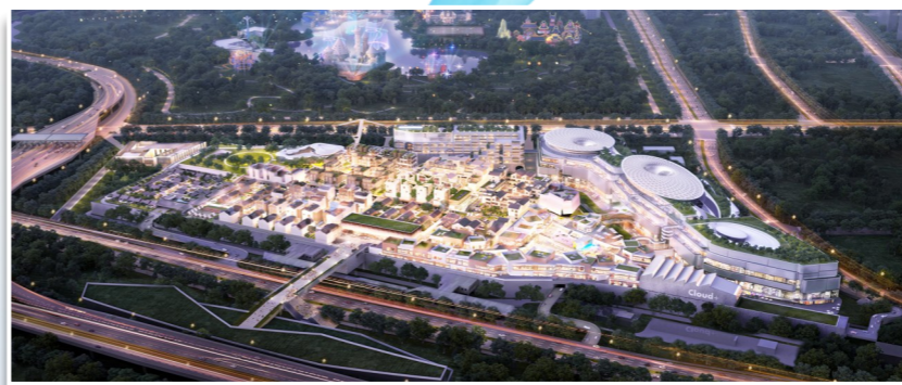
张湾环球奥莱小镇效果图