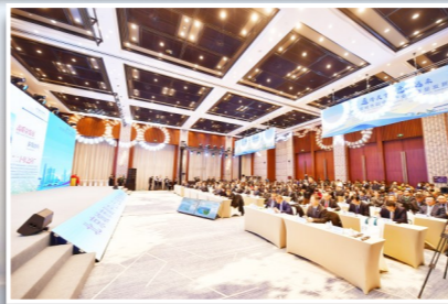
2024北京城市副中心产业高质量发展大会在北京国际财富中心举行。