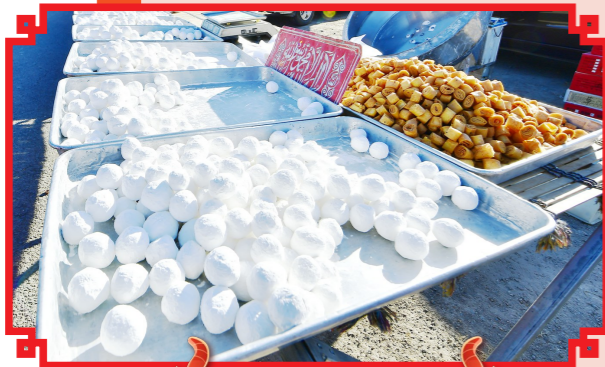
张家湾大集上的元宵馅饼。

很少有人能从大集上空手而归。红彤彤的福字春联，香喷喷的炒货干果，鲜灵灵的瓜果蔬菜，琳琅满目的百货物什……一场大集，让年味更浓。