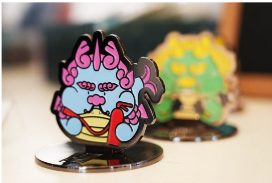
“龙生九子”系列文创。