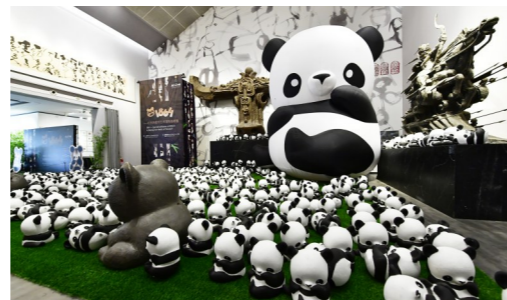
北京韩美林艺术馆