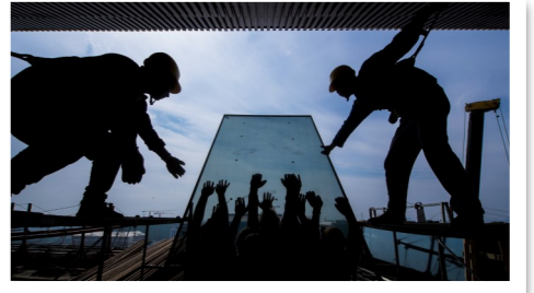
2017年9月14日,行政办公区施工现场。