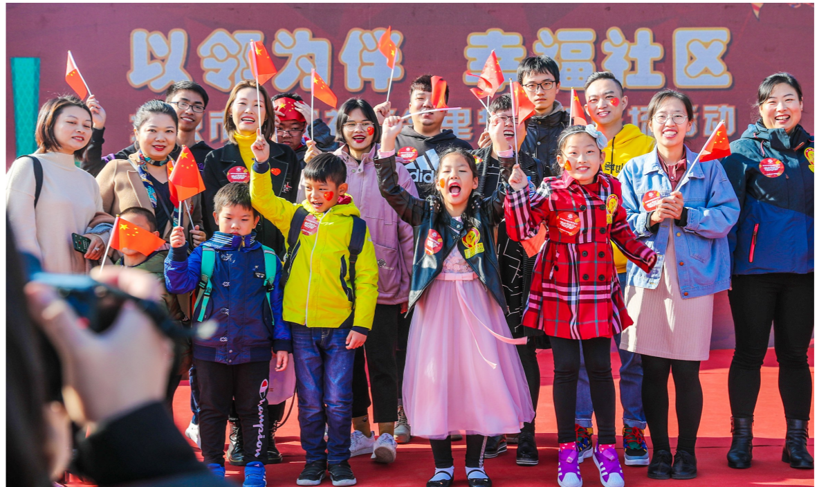
社区邻里节