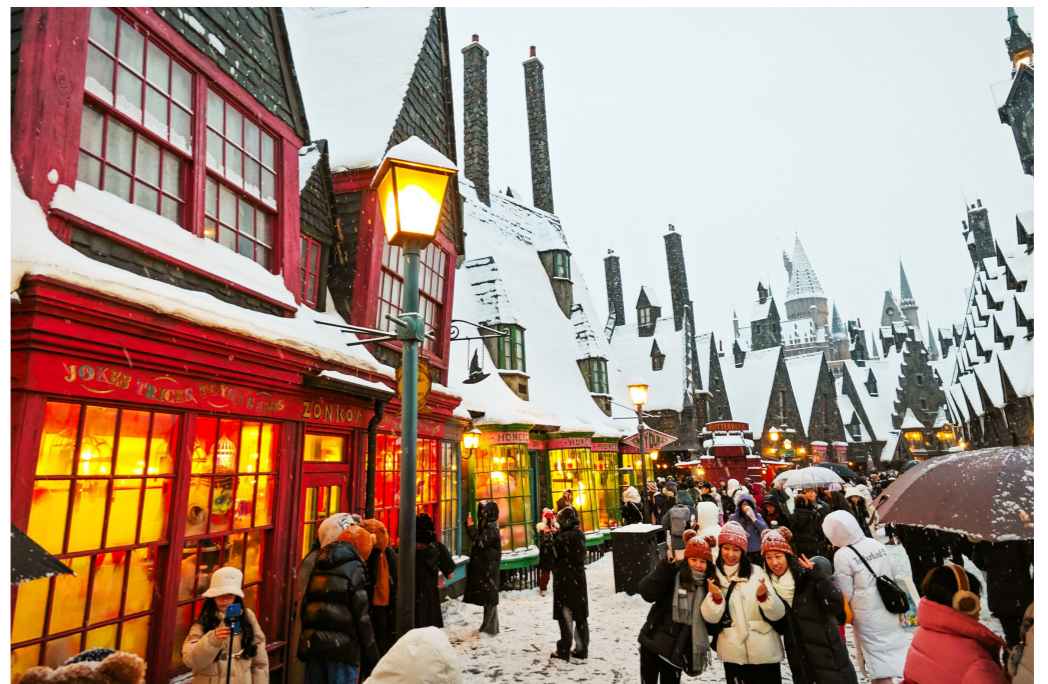
北京环球影城哈利波特景区