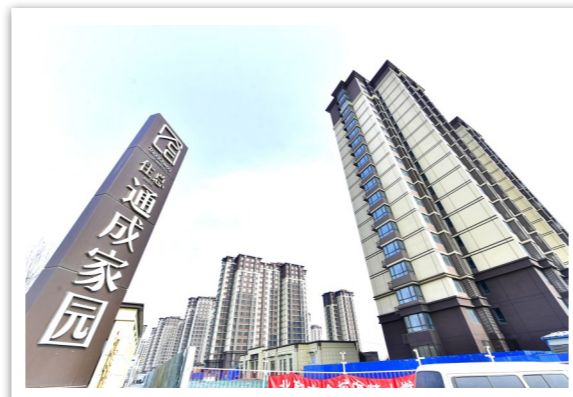
通成家园共有产权房