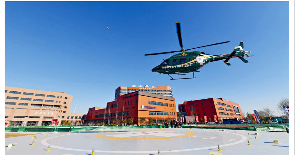
北京大学人民医院通州院区 常鸣/摄