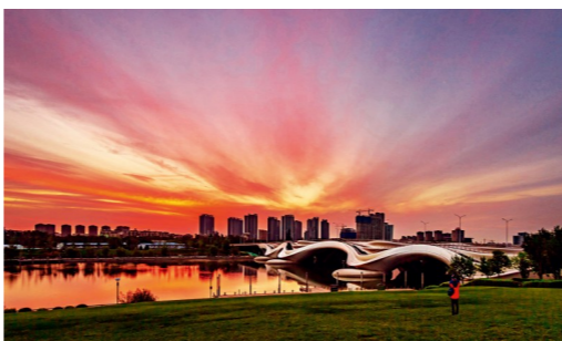
千荷泻露桥