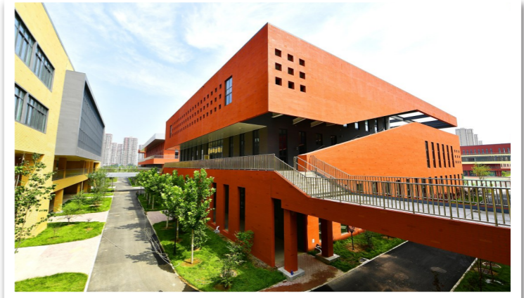
景山学校通州分校