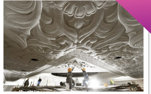
2018年1月24日,工人以工匠精神施工。