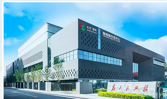
潞城镇市民中心设立“企业服务绿色通道”窗口，实现“企业办事不出镇”。

擘画“十四五”，展望2035，潞城镇将高质量答好市委“二十年之问”，续写践行新时代中国特色社会主义新篇章。