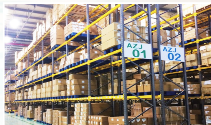
国药器械美迪公司签约入驻潞城。