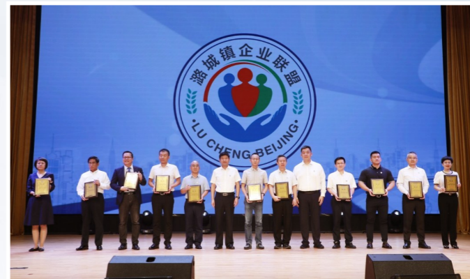
潞城镇企业联盟目前有136家成员企业，搭建企业合作平台。