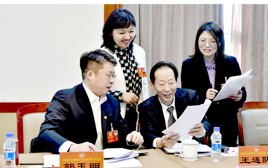
昨天,参加北京市通州区第七届委员会第三次会议的政协委员分组讨论了区政协常委会工作报告和提案工作报告。委员们一致认为,两个报告内容丰富,实事求是地回顾了2023年政协工作,科学部署了2024年各项任务。大家纷纷表示,将在区委的坚强领导下,凝心聚力、务实进取,在答好中共北京市委“二十年之问”,奋力谱写城市副中心高质量发展新篇章中贡献更多智慧和力量。