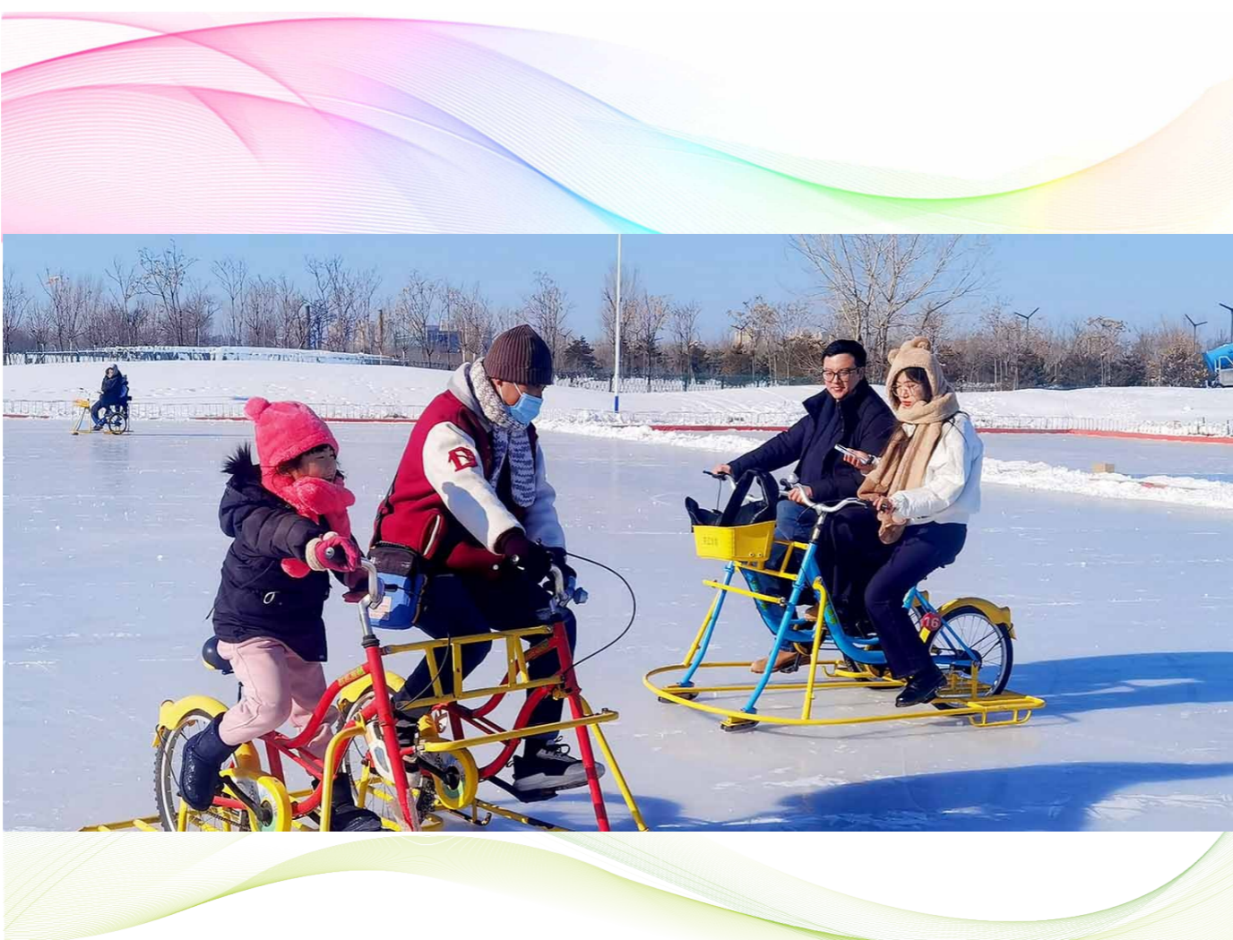
城市绿心森林公园冰雪嘉年华活动启幕,市民畅享冬日时光。

本报讯(记者 陈施君)近日,第四季城市绿心森林公园冰雪嘉年华活动正式启幕。本届嘉年华主题为“运动奏响生命,冰雪点燃激情”,预计持续至2024年2月中旬。